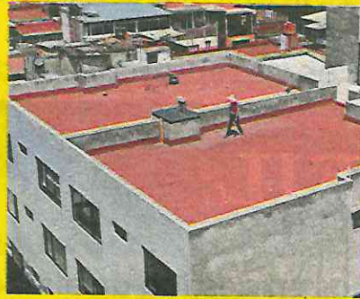
Mujer hace ejercicio en la azotea