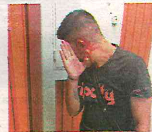
Perdió parte de la oreja

Policías auxiliares asignados a esa estación detuvieron