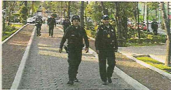
La vigilancia en Venustiano Carranza se realiza a pie y en vehículos

Ya instalamos alarmas vecinales en negocios como Oxxo, Bodega Aurrera, Walmart, entre otras, para evitar