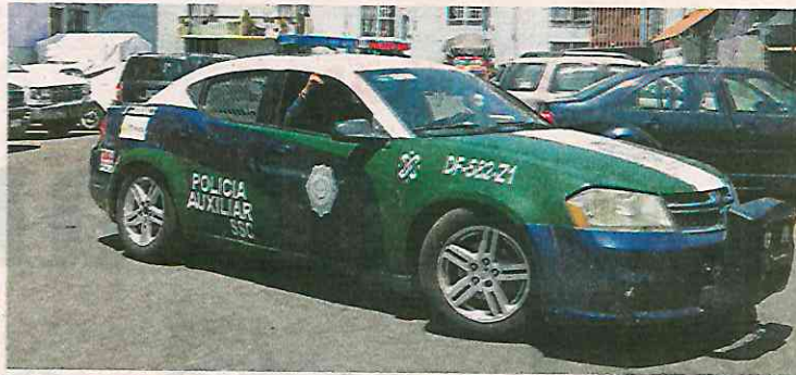
Los patrullajes son continuos en diversas zonas para inhibir a la delincuencia