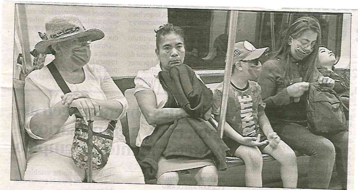
▲ Muchos usuarios del Metro de la Ciudad de México utilizan cubrebocas durante sus traslados. La cantidad de personas que usa este transporte ha disminuido radicalmente y es raro ver niños.