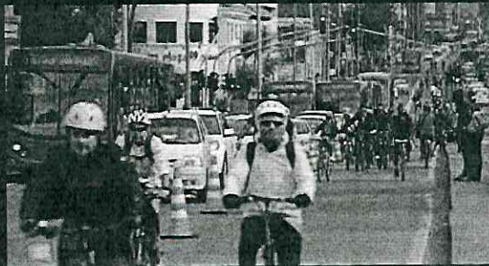
Las ciclovías temporales ya fueron implementadas en Colombia el 16 de marzo pasado debido al COVID-19.

El transporte público en la capital del país sufre aglomeraciones y podría convertirse en un foco de infección del COVID-19, para evitarlo, activistas proponen un plan de ciclovías temporales que promueva a la bici como medio seguro de traslado