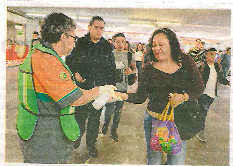
En Pantitlán , una de las estaciones del Metro con mayor afluencia de usuarios, reparten gel