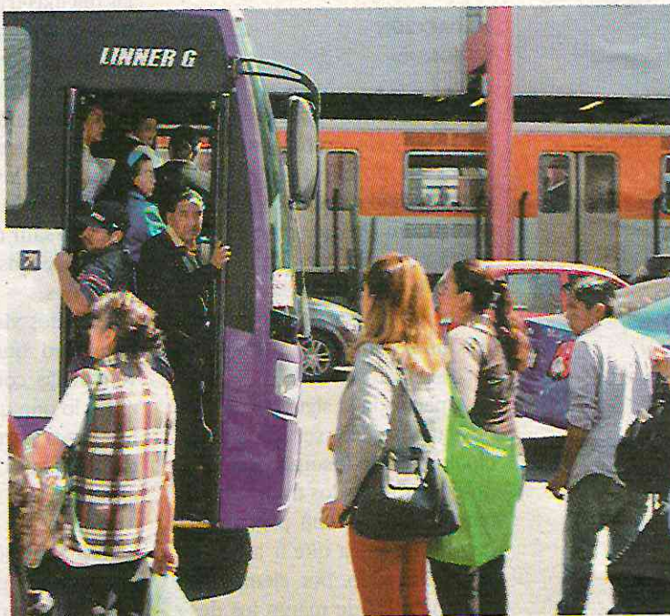
⊕ Los hechos se registraron en 2017; el implicado ha sido identificado en las inmediaciones de la estación de la Línea 2.

Horas después los médicos del hospital confirmaron que Irving falleció por lesiones dolosas con arma blanca.