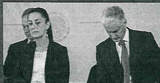
Claudia Sheinbaum y Alfredo del Mazo acudieron ayer a Palacio Nacional.

Autoridades federales y estatales informaron que se destinarán mil 950 millones de pesos y se trabajará de manera coordinada para garantizar la movilidad del nuevo Aeropuerto Felipe Ángeles