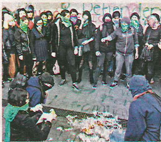
Tras asesinato de la pequeña de 7 años

“Entiendo que sean cuestiones graves, enfrentamos un régimen que desaparecía a personas, que desgració a muchos y nunca rompimos un vidrio. Es posible protestar sin violencia, la no violencia es una opción. No se puede enfrenar la violencia con la violencia”, aseveró.