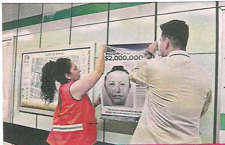
El retrato hablado de la robachicos fue colocado en el Metro Guerrero.