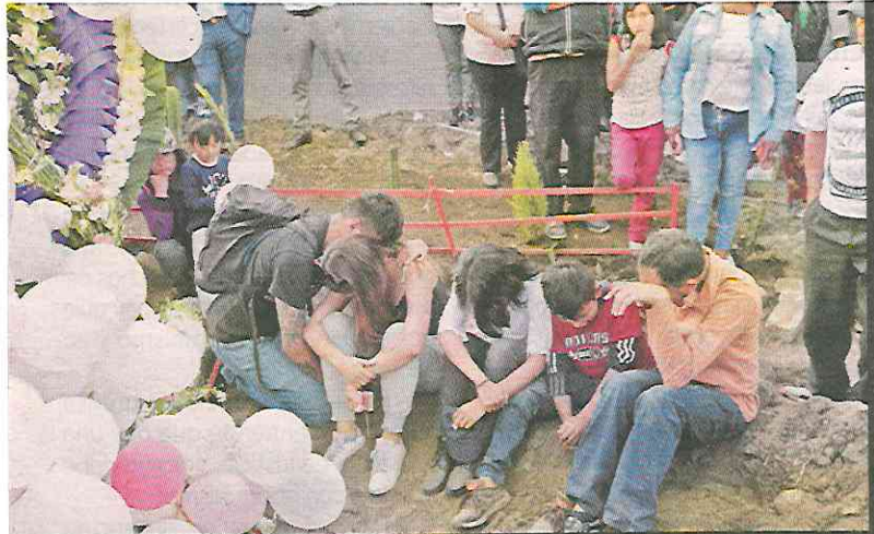
Muchos no daban crédito de lo que le sucedió.