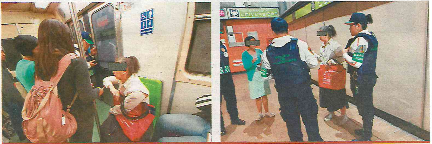
Momentos en que una señora fue señalada como la posible persona que raptó a la niña Fátima, y que tras varios minutos fue exonerada; los hechos, en la estación del metro Zapata.

hora seguía diciendo que la estaban calumniando. “¿cómo le hago para denunciar que me tienen detenida aquí?”, dijo.