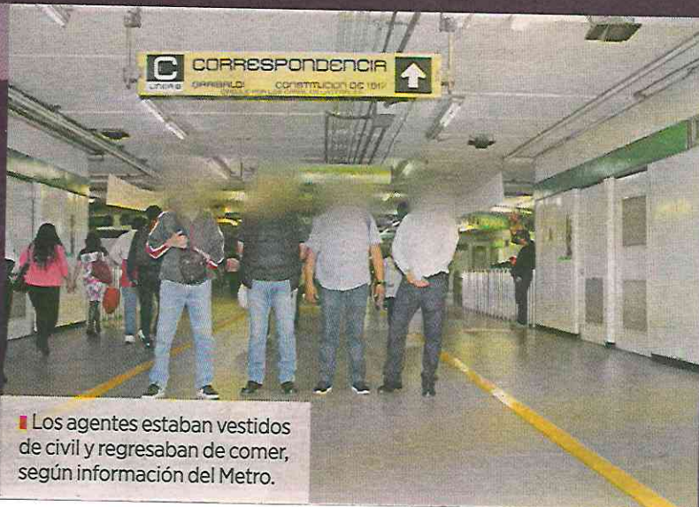
Los agentes estaban vestidos de civil y regresaban de comer, según información del Metro.