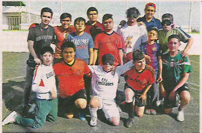
El equipo está conformado por 15 personas de todas las edades, el portero es la única persona que puede ver.