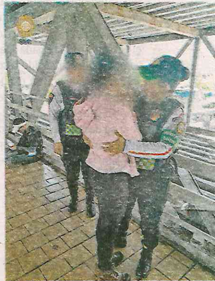
La joven trató de arrojar a las vías del Metro en la estación Constitución1917

Posterior a la valoración, se entabló comunicación con sus familiares, en con-