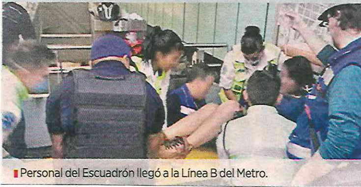
Personal del Escuadrón llegó a la Línea B del Metro.

Paramédicos del ERUM llevaron a un hospital a la pasajera.