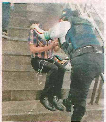
Fue oportuna la intervención del personal del Metro y la PBI

La oficial se acercó a él para indagar si le sucedía algo y en su caso poderle brindar el apoyo y fue ahí cuando el joven dijo