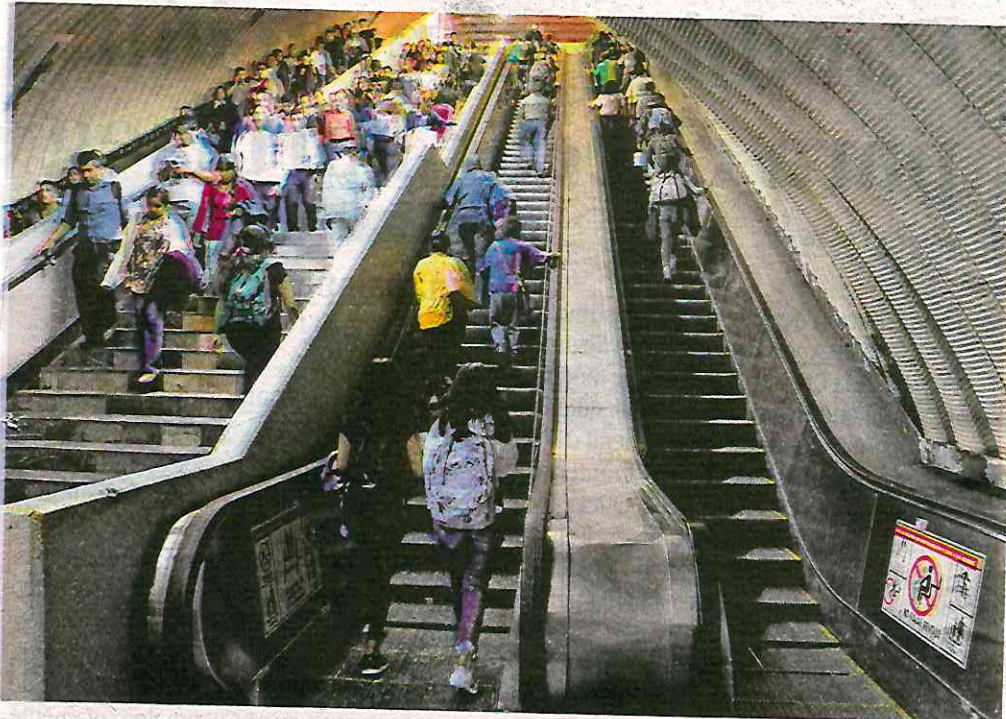
No existen señalamientos de la pausa del servicio en las escaleras eléctricas