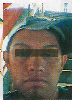
La Carlota, cobrador.