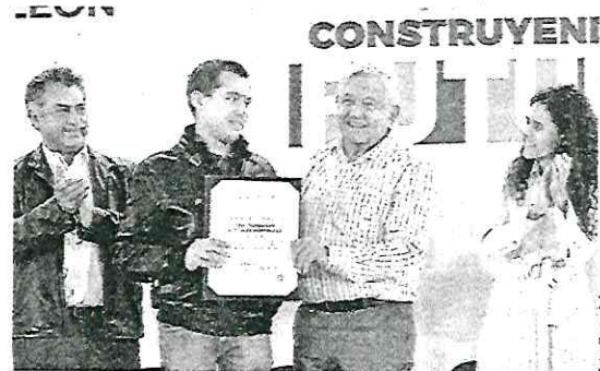
El Ejecutivo Andrés Manuel López Obrador (centro) entregó su certificado a un aprendiz de Jóvenes Construyendo el Futuro.

En el acto, Rodríguez Calderón fue abucheado por quienes acusan a su administración de querer subir el precio del transporte público. En respuesta, el mandatario estatal aseguró que pese a las deudas del estado, no aumentarán las tarifas.