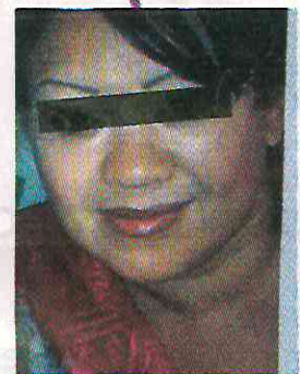
La Kena Mamá, cobradora.