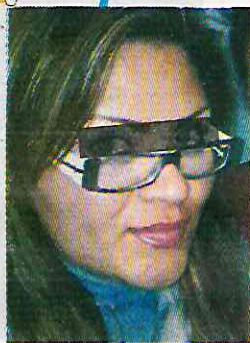
La Kena, cobradora.