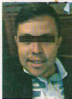
La Guayaba, golpeador.