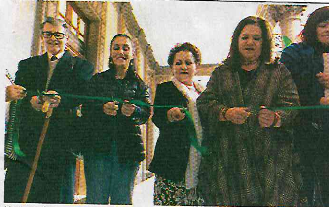
Nuevos foros para la cultura en el corazón de la Ciudad de México.

Durante la inauguración, el secretario de Cultura,