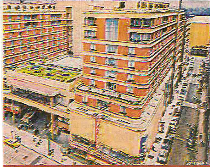
El Hotel del Prado era propiedad pública, planeado originalmente para acoger al gran turismo. También tuvo cine, y una librería, la Del Prado, con un surtido importante de libros de arte. Su joya, incómoda en alguna época, era el mural pintado por Diego Rivera, Sueño de una tarde dominical en la Alameda Central., rescatado para darle su propio museo en la acera de enfrente.

Cada nuevo descubrimiento le agrega datos al recuento de lo que, ya sabe todo el país, es una tragedia. El que puso el título principal en el extra del periódico Ovaciones , sintetiza en una exclamación la mezcla de miedo y de azoro que invade a la gente: "¡Oh, Dios!".