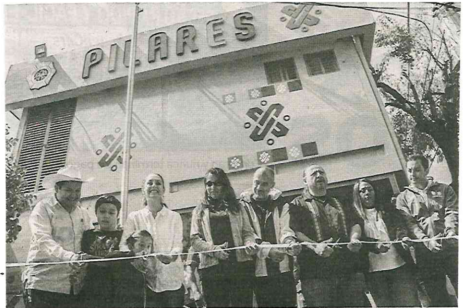
El programa principal del Gobierno de Sheinbaum

· Puso en marcha un gran programa en materia de movilidad para recuperar el esplendor del STC-Metro