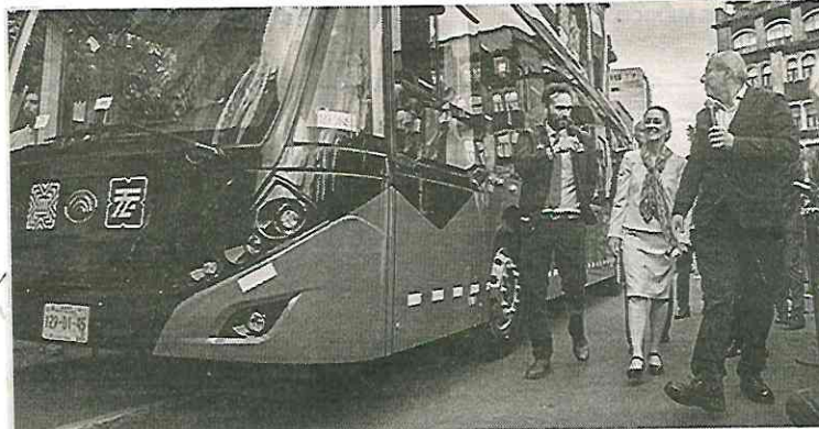
En la presentación del moderno trolebús

Eliminó el programa de niños talento y lo hizo universal, otorgando desde este mes 330 pesos cada 30 días a todos los estudiantes de primaria y secundaria sin importar sus calificaciones.