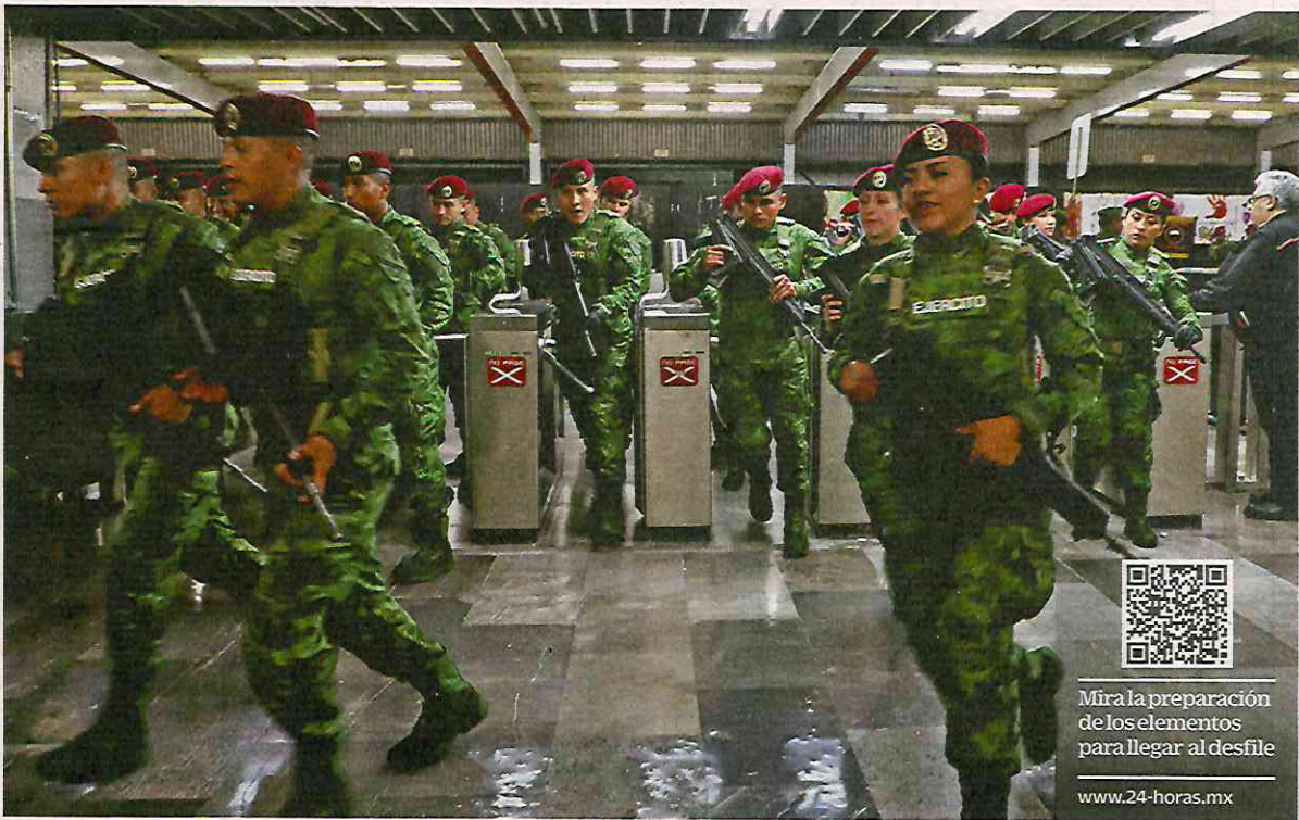
VIAJE. Los elementos fueron trasladados en el Metro hacia el Zócalo capitalino, a donde llegaron desde las 5 de la mañana.