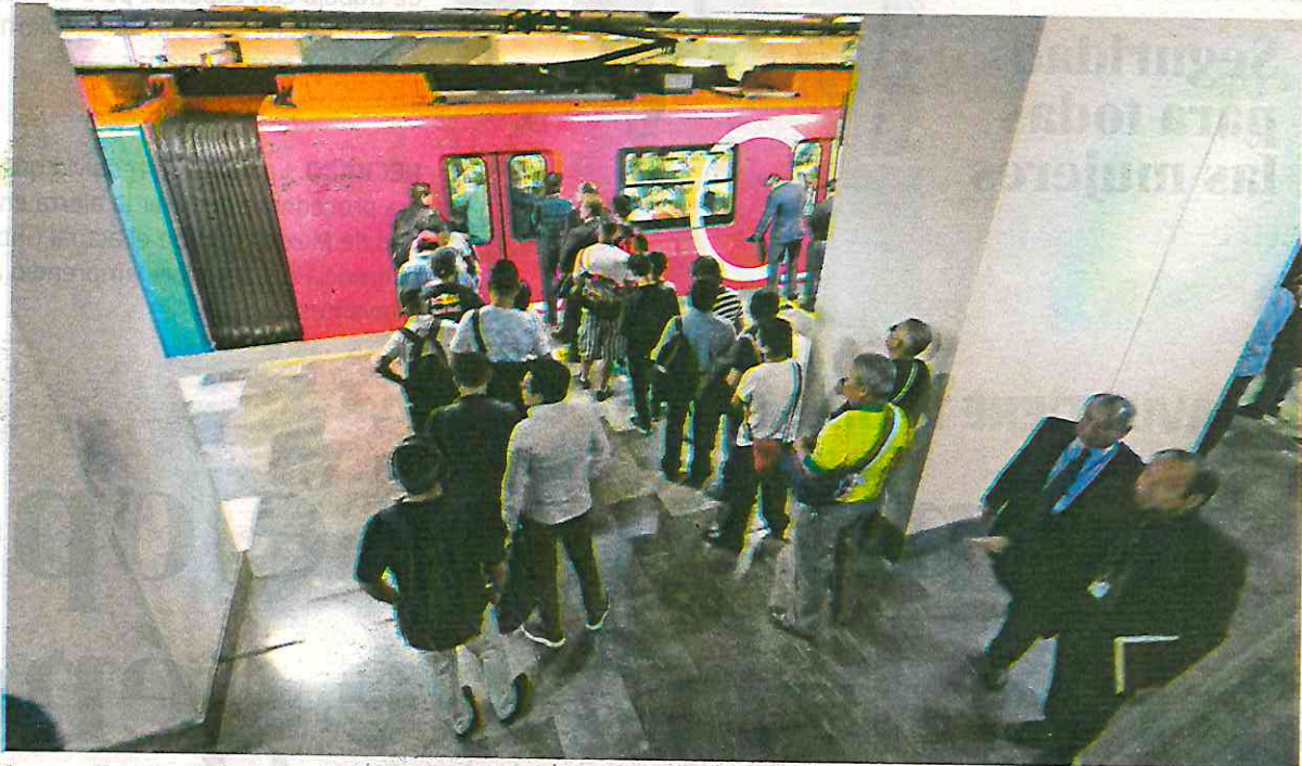
La ampliación de la Línea 12 está prevista para que culmine en 2021

MILLONES 533 mil pesos es el presupuesto mínimo del mantenimiento