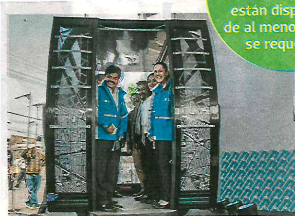
Sheinbaum destacó que es un proyecto que garantiza el derecho al transporte sustentable

30% DE LOS PREDIOS ya están disponibles de al menos 70 que se requerirán