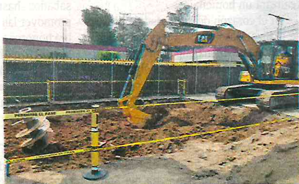
La terminal Indios Verdes quedará dentro de los talleres del Metro