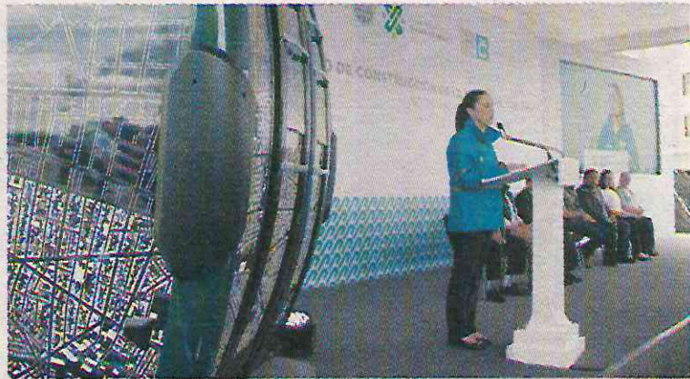
Claudia Sheinbaum. Una realidad.

“Vivienda en Conjunto” del Instituto de la Vivienda (INVI), entregó un inmueble con 149 departamentos en beneficio de familias de Iztapalapa. Sheinbaum Pardo, señaló que actualmente la mayor parte del presupuesto del Instituto de Vivienda se destina a la reconstrucción pero una vez finalizado el proceso, que se estima concluya en 2020, se desarrollarán más proyectos de vivienda social.