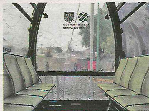
10 usuarios en cada una