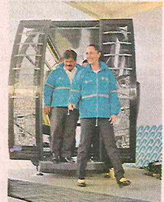
■ CSP probó una góndola.

Las autoridades capitalinas tienen previsto que la primera línea del sistema se termine de construir en menos de 500 días.