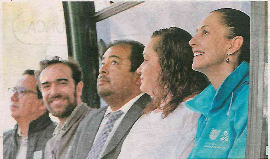
La jefa de gobierno, Claudia Sheinbaum, al iniciar obras del Cablebús Cuauhtepec-Indios Verdes

“Hoy damos el inicio de obra del Cablebús Cuauhtepec-Indios Verdes, es la primera línea de un nuevo Sistema de Movilidad en la Ciudad de México, que es una movilidad sustentable, utiliza muy bajo