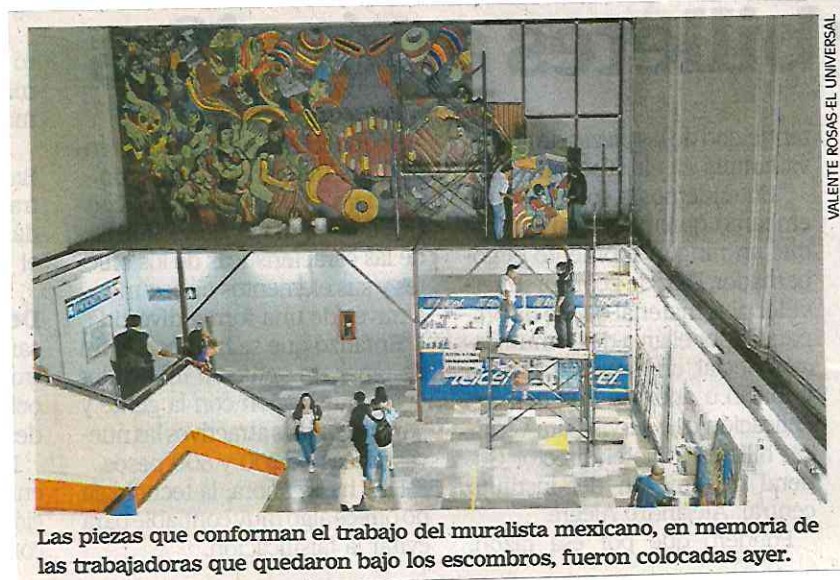
VALENTE ROSAS EL UNIVERSAL

Además, fundó la Asociación Civil Creadores del Arte Público de México y fue presidente de la Unión Latinoamericana de Muralistas. ●