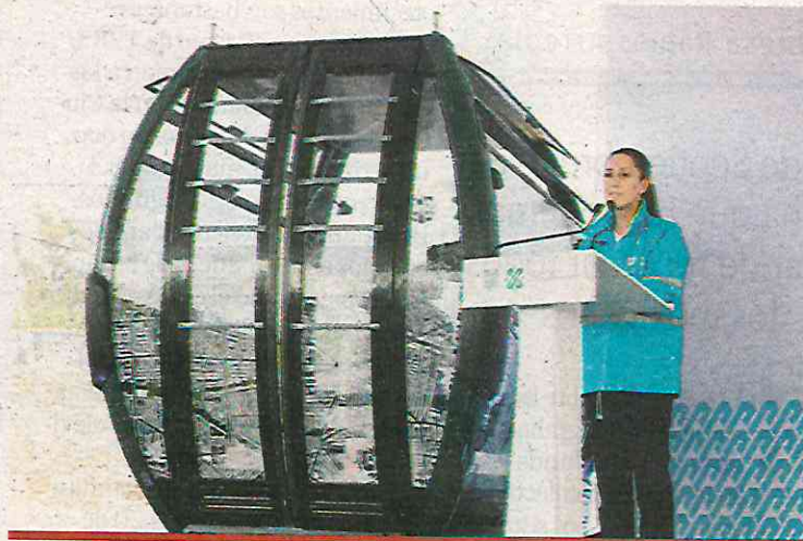
Se prevé que traslade hasta ocho mil personas cada hora y 160 mil personas diariamente, dice Claudia Sheinbaum.

se tuvo que cambiar el trazo y no incluir la estación IPN porque los estudiantes de esa institución de educación superior rechazaron su construcción, aunque las estaciones aledañas están muy cerca.