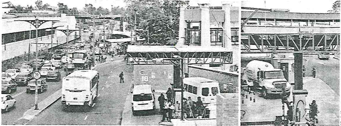
Los usuarios que arriban a la terminal del Metro Pantitlán, por la Línea 5, y salen al Cetram por la primera escalera, se encuentran de frente con la gasera.

Señala experto peligro de explosión por cercanía con el Metro