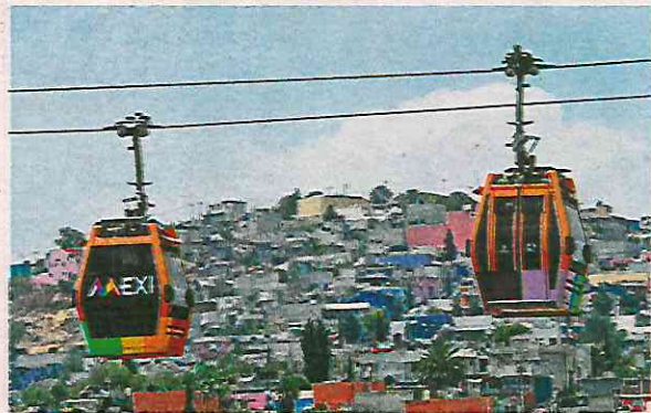
El Cablebus de Iztapalapa será similar al que opera en el municipio de Ecatepec

El funcionario afirmó que esta empresa tiene experiencia, sobre todo en América Latina, en Colombia y en Bolivia, donde han hecho los sistemas más grandes, pero también en México, esta empresa ha construido teleféricos, en caso de Leitner, ha construido en el Estado de México".