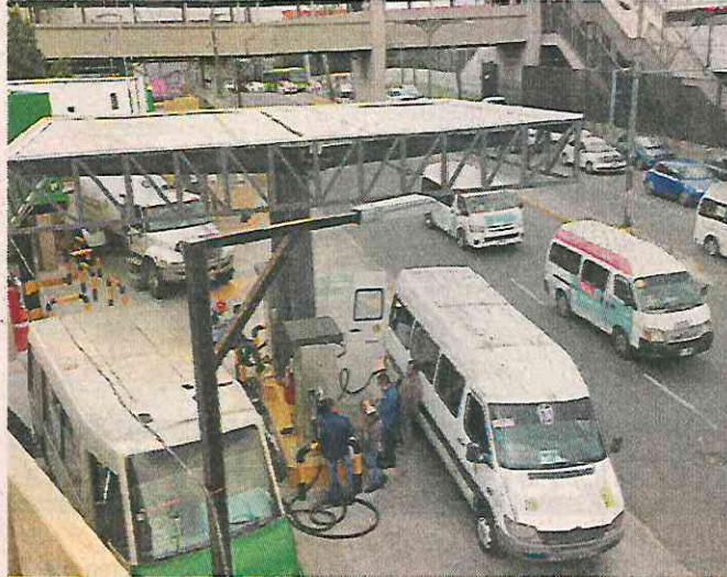
■ En la gasera se surte de combustible el transporte público, pero también cilindros caseros.

Asimismo, REFORMA observó en tres visitas diferentes que el tanque era abastecido por pipas de la empresa Luxor, incluso, en horarios de alta afluencia de pasajeros, como la salida y entrada de escuelas.