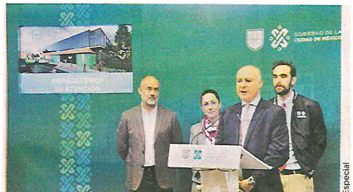
Las conexiones, especificaron autoridades, se encuentran en las faldas de la Sierra de Santa Catarina, una zona marginada.

Las autoridades agradecieron la asesoría de la Oficina de las Naciones Unidas de Servicios para Proyectos (UNOPS) para garantizar la calidad del Cablebús.