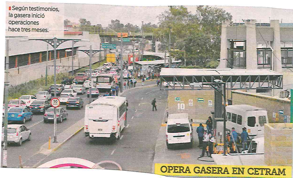
OPERA GASERA EN CETRAM

■ Según testimonios, la gasera inició operaciones hace tres meses.