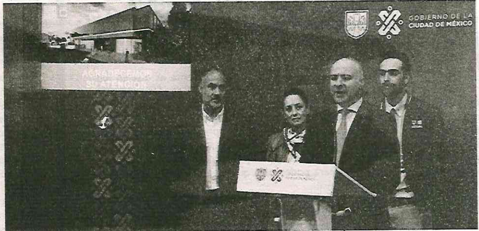
Se trata de la construcción Línea 2 del Cablebús en Iztapalapa, así como tres puentes vehiculares: Periférico-Cuemanco-Canal Nacional, Ampliación Emiliano Zapata y Circuito Interior-Eje 6.

En tanto, el representante de la UNOPS en México, Fernando Cotrim Barbieri, expuso que el acompañamiento se realizó en la valoración de los costos estimados del proyecto, así como