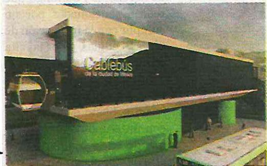
La construcción iniciará en noviembre

· DICSA construirá el puente de Emiliano Zapata e IDINSA los puentes de Eje 6 y Canal Nacional