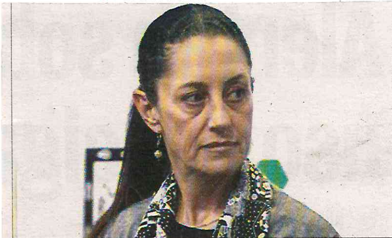
Claudia Sheinbaum. Alternativa de movilidad.

Se aseguró que en las cabinas podrán viajar 10 personas y se detonarán entre mil 200 y mil 500 empleos; la puesta en marcha se contempla en 18 meses, una vez que arranque.