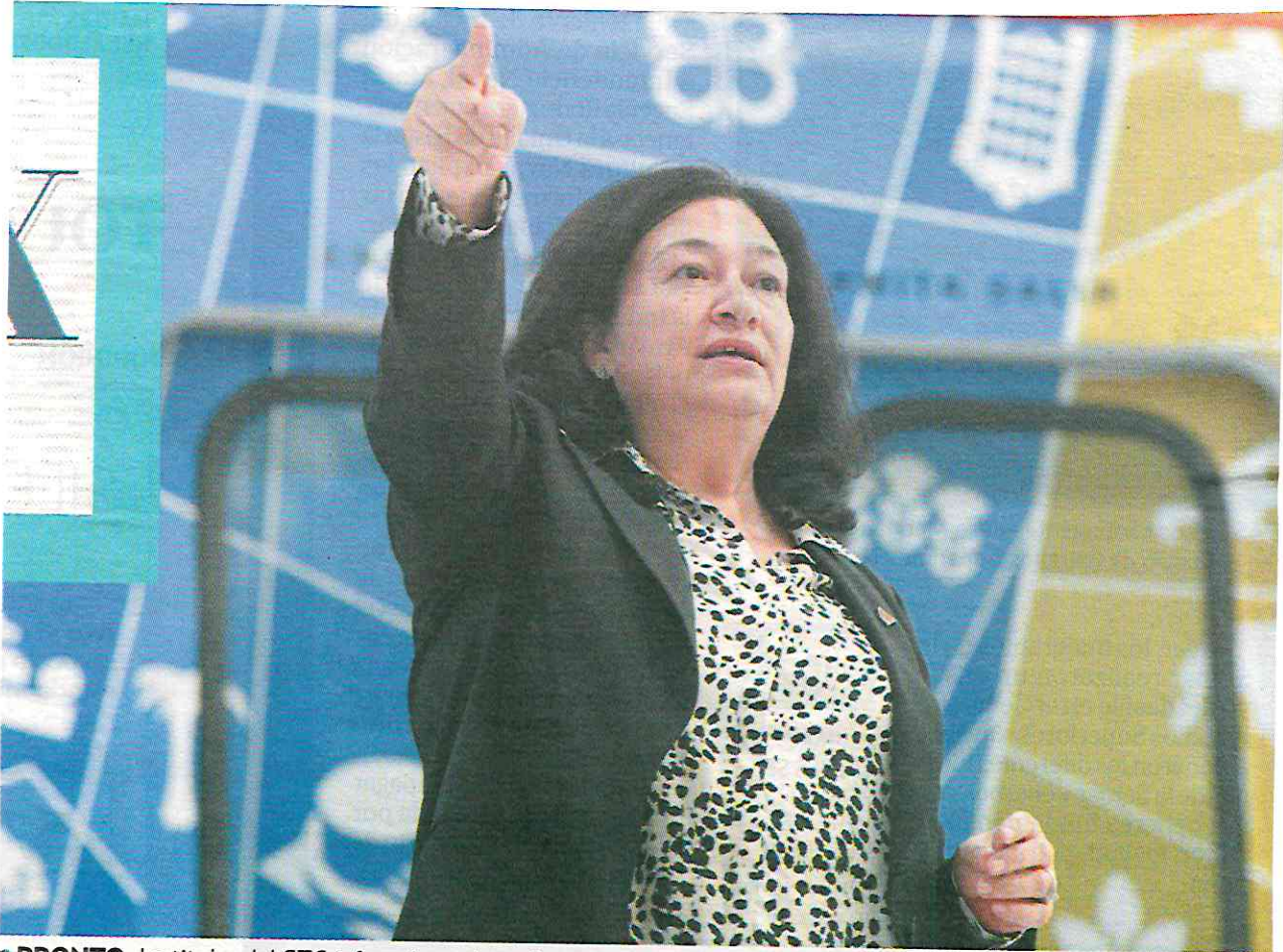
● PRONTO. La titular del STC informó que los primeros recursos se destinarán a la Línea 1.