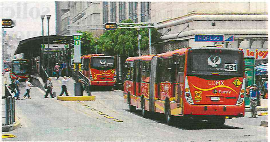
En total, de Tenayuca a Xoco, habrá 40 estaciones

Aunque el trazo planteado es que la extensión corra por carriles centrales del Eje 1 Poniente Cuauhtémoc hasta Río Churubusco, en la parte que pasa por el Pueblo de Xoco la Secretaría de Movilidad y el Metrobús tendrán que realizar una consulta con los vecinos, para que ellos determinen si avalan o no esta obra de transporte público.