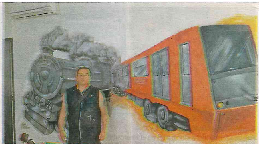
La víctima laboraba en el Sistema de Transporte Colectivo Metro

La familia extrañada primero por su ausencia y luego preocupada por la falta de comunicación, y porque no contestaba el celular, decidió acudir a la Fiscalía Especializada en la Búsqueda, Localización o Investigación de Personas Desaparecidas (FIPEDE). Ahí se elaboró el boletín número (AYO/ 387/ 2019) de su ausencia. Se le buscó en hospitales y agencias del Ministerio Público, sin embargo, no lo ubicaron.