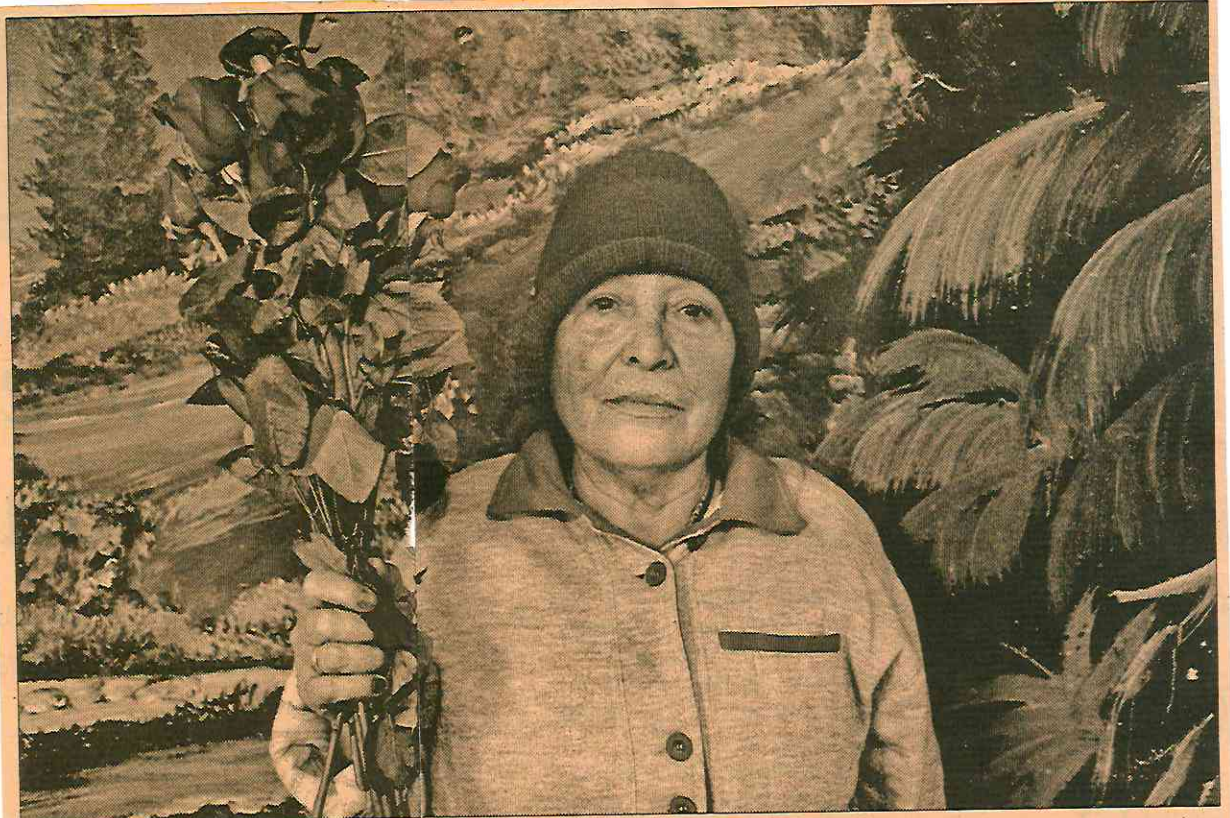
Trabajo que será parte de Welcome to Lipstick , de Maya Goded, en el Centro de la Imagen.

mecenas española Anna Gamazo, en la que se ofrecerá una relación de los contextos políticos y sociales del trabajo de 12 artistas latinoamericanas durante las décadas de los años 70 y 80. Ahí mismo, la fotógrafa mexicana Maya Goded hablará sobre las trabajadoras sexuales y las relaciones de poder que las trastocan en la muestra Welcome to Lipstick .