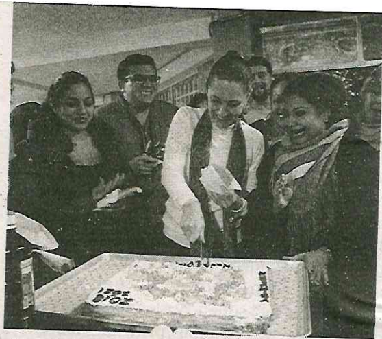
La Jefa de Gobierno, reconoció que la federación invierte mucho en la capital

El presupuesto para el próximo año- alrededor de 238 mil millones de pesos- estará compuesto por el 53 por ciento de aportaciones federales y 47 por ciento por aportaciones del GCDMX