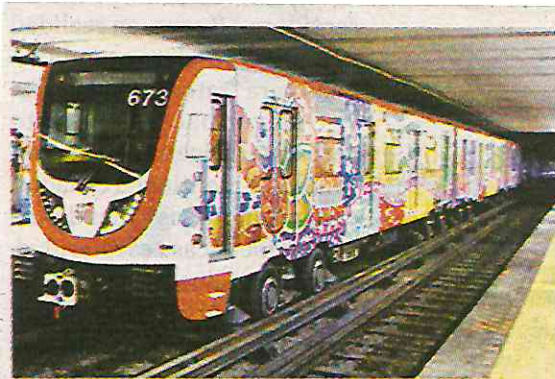
Viene en serio su modernización

Recordó que es legal hacerlo y factible, ya que el GCDMX no cuenta con recursos propios para la modernización de este transporte; enviarán petición de autorización al Congreso.