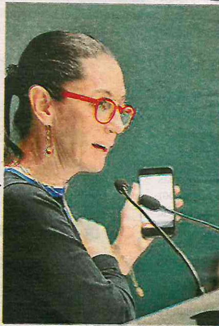
El objetivo de las autoridades con esta medida es evitar la corrupción y delitos