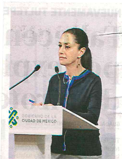
La mandataria dijo que hubo un error en el Presupuesto 2020

MMDP ES la deuda que solicitará para la modernización del Metro de la ciudad