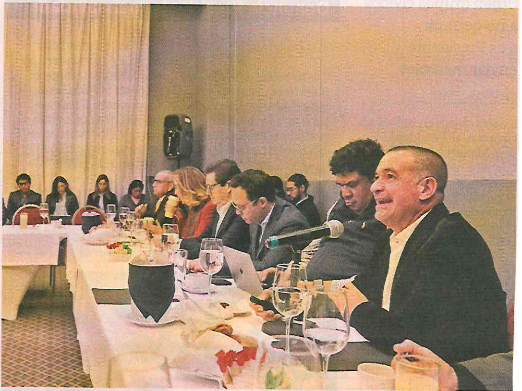
■ Expertos participaron ayer en un taller sobre seguridad pública organizado por el Consejo Consultivo Ciudadano "Pensando en México".

"Por eso la necesidad de las reuniones de las seis de la mañana con todo el gabinete de seguridad, y de la construcción de una estructura de coordinaciones estatales y regionales para monitorear la operación cotidiana de todo el aparato de seguridad del país".