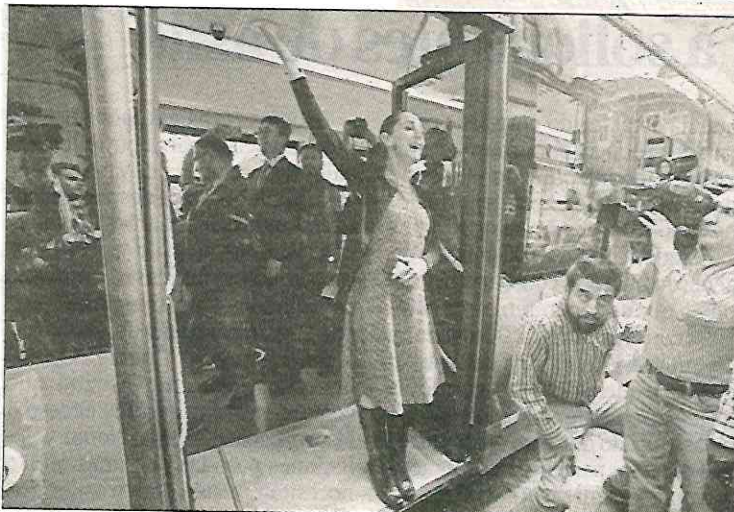
◀ La jefa de Gobierno abordó uno de los 40 nuevos trolebuses, que la llevó hasta el Zócalo.

Por la tarde, la jefa de Gobierno entregó apoyos económicos para mantenimiento de unidades habitacionales en Álvaro Obregón.