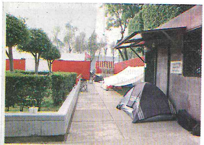
ANTORCHA CIERRA TÚNEL DEL METRO

Delgado dijo que no renunciarán a su derecho de sesionar en la Cámara de Diputados. "Hoy buscaremos, por medio del diálogo, que pueda liberarse la Cámara, porque el país no puede estar sin presupuesto".