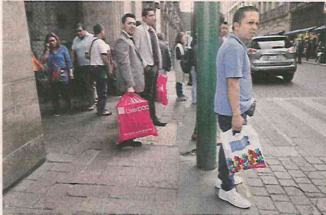
Al menos en horario laboral, y pese a que fue el primer día, las calles del Centro lucieron con afluencia habitual.