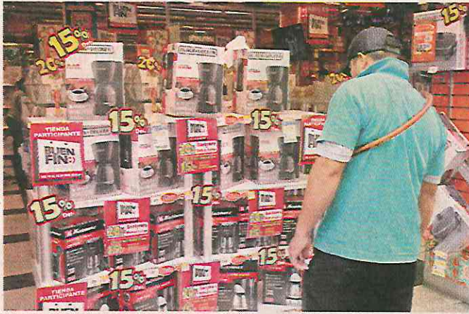
Algunos capitalinos comparan los descuentos de la venta especial con los precios de unos días antes.