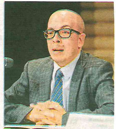
Volpi criticó las pintas

Lomelí explicó que la solución será poderlos ubicar y aplicar las medidas según la ley pues no les corresponde la detención o procesamiento, pues "no son un estado dentro del estado". Descartaron realizar algún tipo de cerco de seguridad en Rectoría y de seguridad personal para el rector Enrique Graue.