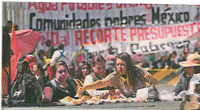
■ Un grupo de mujeres reparte la comida para los campesinos que acampan en San Lázaro.