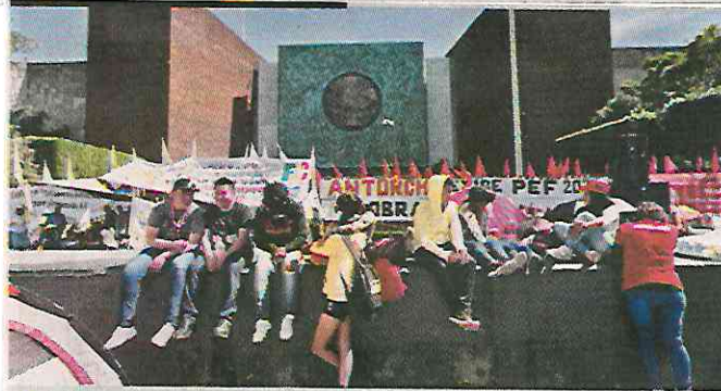
■ Jóvenes movilizados por Antorcha Campesina ayer en el acceso principal al recinto legislativo.

En el límite legal para aprobar el Presupuesto de Egresos, la Cámara de Diputados permanece bloqueada por grupos que exigen más recursos federales.