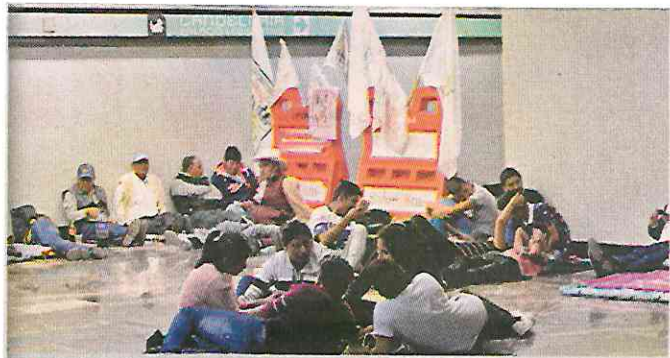
■ El plantón se extendió hasta la estación Candelaria del Metro.