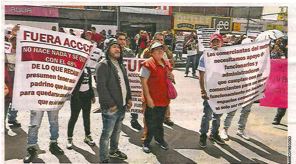
DEMANDAS. Más de 50 comerciantes se manifestaron sobre Avenida Chapultepec, exigiendo que se respeten sus derechos y en contra de la empresa ACCCO, que les arrienda los locales.