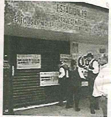
Las clausuran y cambian de giro

Están disfrazadas de restaurantes y pizzerías y son lugar preferido de universitarios