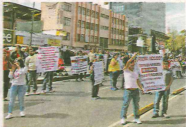
Los vendedores se manifestaron afuera de la estación del Metro Salto del Agua

Por esa razón más de 300 trabajadores que laboraban en los locales de las estaciones del metro, se manifestaron afuera de la sede del STC-Metro, en la calle de Deli-