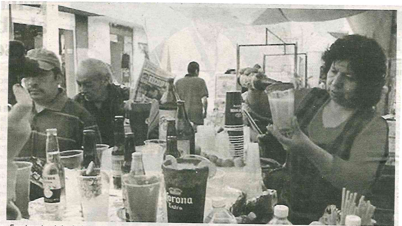
Funcionarios de la alcaldía piden moches para dejarlas funcionar

Esta zona tiene permitido un máximo de 3 pisos y un mínimo de 30% de área libre para construcciones, sin embargo, en la calle de Medicina número 63 se realizó la construcción, ampliación y remodelación de este predio, por lo que los vecinos solicitaron al Instituto de Verificación Administrativa de la Ciudad de México (Invea), información sobre los permisos para llevar a cabo estas obras, agregó.