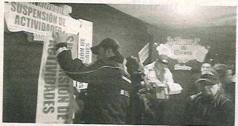
· Sólo unos días permanecen cerradas

CIUDAD DE MÉXICO. — Con la finalidad de resguardar la integridad física de los habitantes de la colonia Copilco Universidad y de las 40,000 personas -entre estudiantes, profesores y trabajadores de la UNAM-, que diariamente utilizan el Metro y diversas rutas de transporte que llegan a la estación, el Congreso