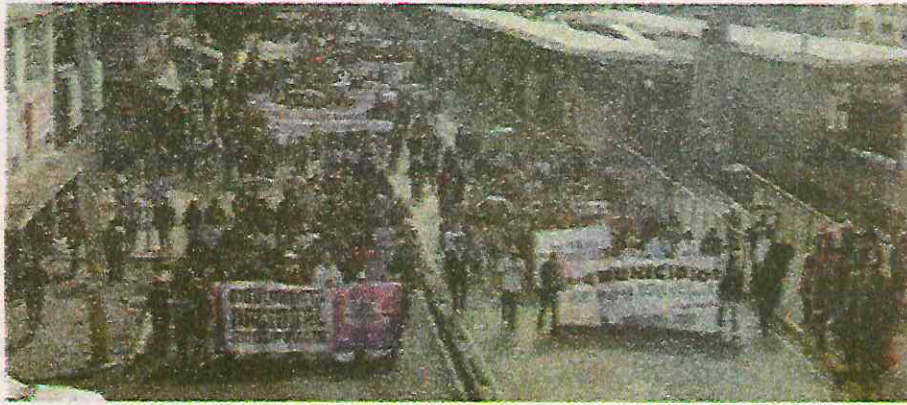
Ciudadanos realizaron marcha hasta la Cámara de Diputados.

Aseveró que los colonos de varias comunidades tampoco tienen acceso a la autopista México Puebla porque se encuentran encajonados en sus sitios de residencia, ante la negativa institucional para brindarles alternativas de desarrollo y movilidad.