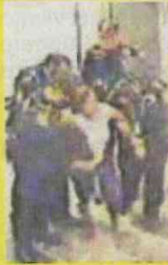
Se desmayó en los andenes.

La Procuraduría General de Justicia de la Ciudad de México (PGJ-CDMX) aportó los elementos de prueba del caso en agravio de una usuaria del Sistema de Transporte Colectivo (STC) Metro, quien no recibió la atención médica debida, lo cual de-