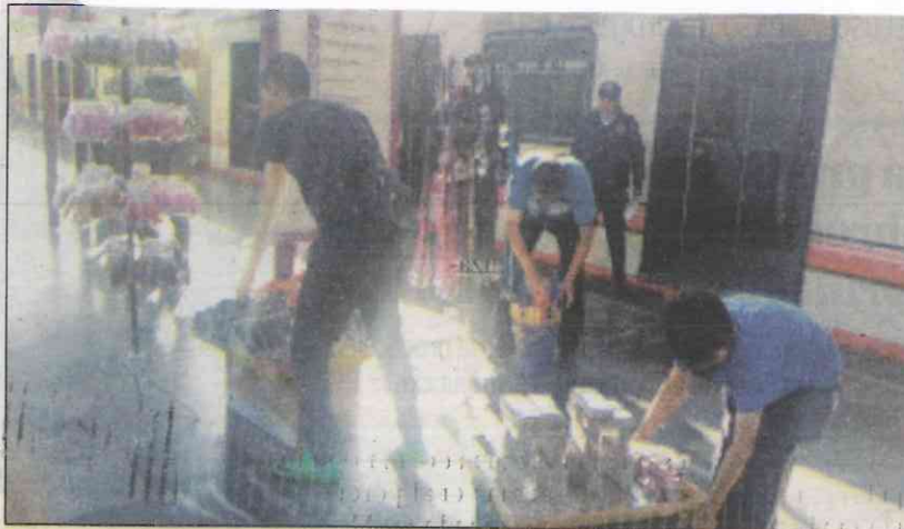
Los elementos de seguridad inhibieron el comercio informal dentro de las estaciones.

nera ordenada el tránsito de los usuarios.