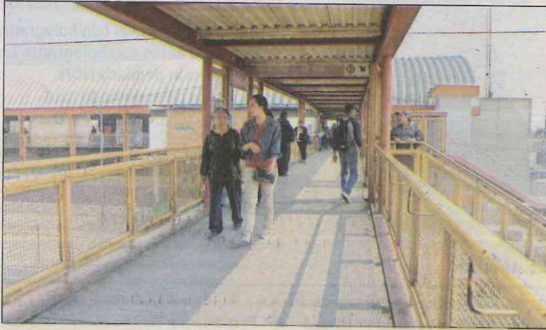
Dicho operativo se realizó con el objetivo de garantizar el libre tránsito de los usuarios.

Asimismo, en la estación Santa Martha, trabajadores del Metro colocaron 50 dovelas en hilera, creando carriles para la salida y entrada de personas, lo que coadyuvó a agilizar de ma-