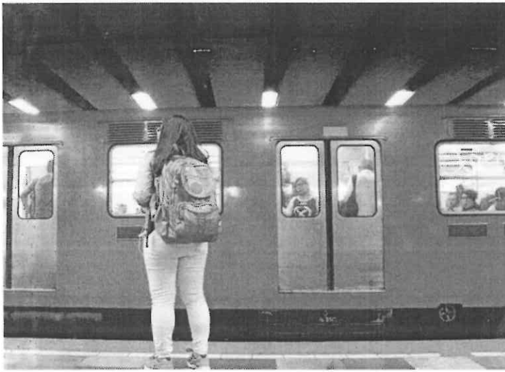
Metro CDMX