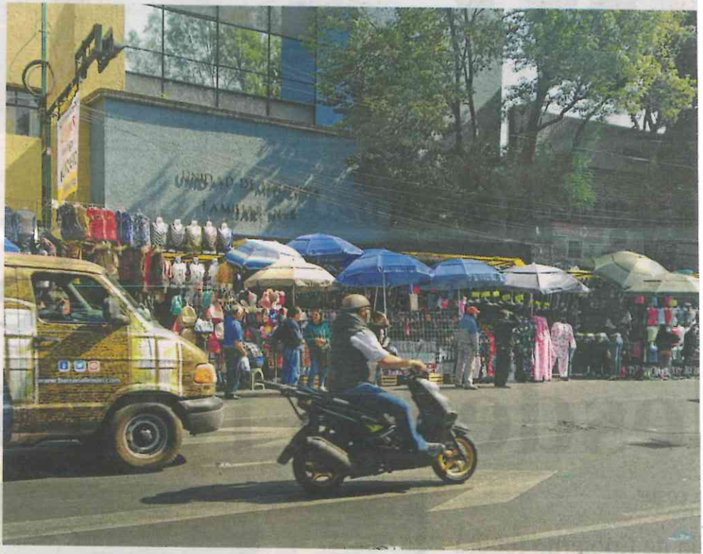
Las banquetas de Moneda en su cruce con Eje 1 han sido tomadas

• Las entradas y salidas de las estaciones del Metro en Iztapalapa también representan una zona no atendida