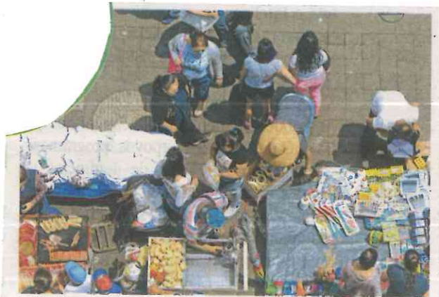
Diversas administraciones han intentado poner orden sin resultados concretos