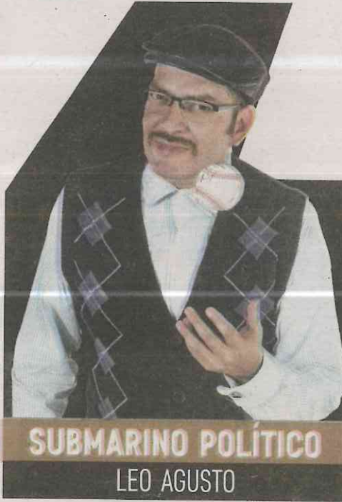
SUBMARINO POLÍTICO LEO AGUSTO

Usted no lo sabe, pero el Presidente abrió ya el segundo sobre que le dejó Peña: "Culpa a tus subalternos". A 100 días de gobierno, los llamados súper delegados federales no han podido cumplir con la en-