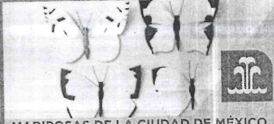
MARIPOSAS DE LA CIUDAD DE MÉXICO. UN ALETEO MULTICOLOR SALTO DEL AGUA, LÍNEA 3.

El escultor Davit Nava nos invita a conocer las 78 diferentes especies de mariposas de aproximadamente 30 y 40 cm de envergadura realizadas, en cartón y alambre, con la finalidad de crear conciencia de que con una selección adecuada de las plantas que sembremos podemos generar una contribución importante mejorando el hábitat para hacerlo amigable con los polinizadores que nos rodean.