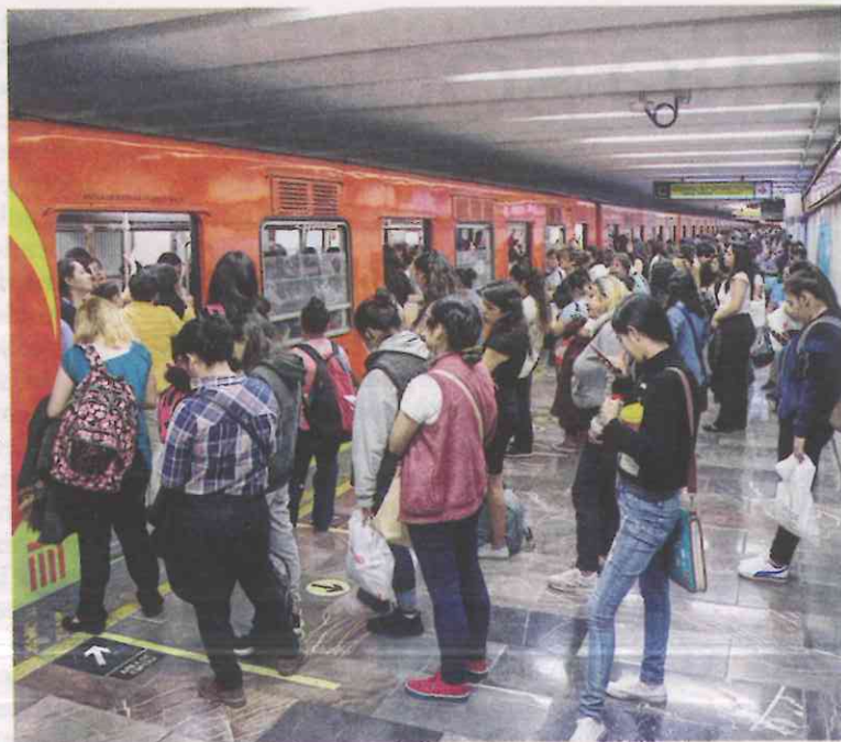
FALLAS. Son constantes los retrasos en las principales líneas del Metro.

Actualmente el Sistema de Transporte Colectivo (STC) Metro cuenta con 380 trenes, de los cuales 270 operan diariamente, pero 110 de ellos están en alguna etapa de mantenimiento permanente y sólo tras ese proceso de reciclado en los talleres entran en operación.