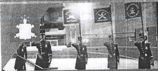
EJÉRCITO Y FUERZA AÉREA MEXICANOS COLEGIO MILITAR, LÍNEA 2

Sexta estación emblemática, que en un área de dos mil 400 metros cuadrados rinde homenaje a hombres y mujeres de las fuerzas castrenses mexicanas. Las imágenes evocan al sistema educativo militar con especialidad en Áreas de Salud, Medicina Militar, Enfermería, Odontología, así como el adiestramiento, aplicación del Plan DNIIIE, labor social, desfiles, ceremonias y espectáculos aéreos.