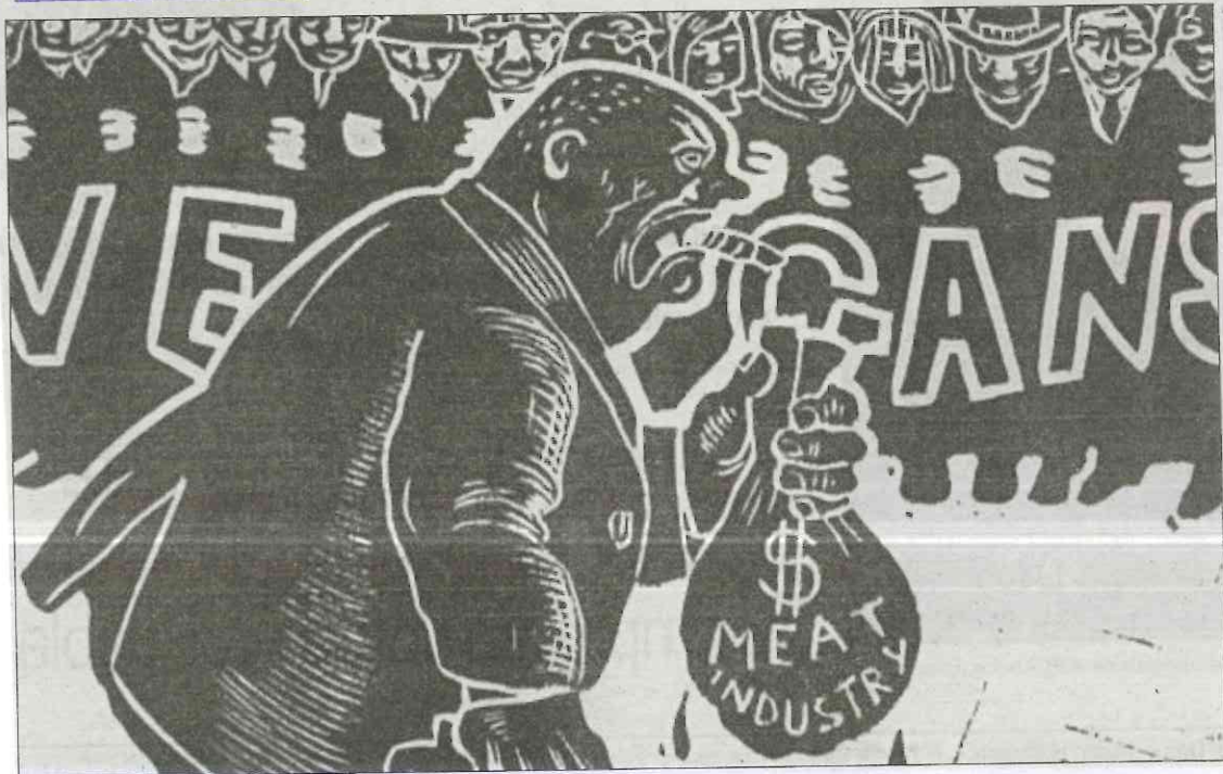
Sus obras retrataban la vida de los animales en los mataderos de Inglaterra.

Se denomina también grabado a la inscripción de texto realizada en una plancha, piedra o metal, aunque no tenga por fin realizar copias.