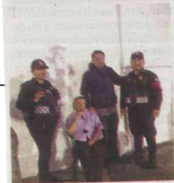
FINAL FELIZ. La mujer fue encontrada por elementos de la Policía Bancaria.

Para la agente, quien también es madre, la satisfacción más grande de su vida es servir a la ciudadanía, lo cual, asegura, seguirá haciendo hasta el final de su vida laboral. /IVÁNMEJÍA