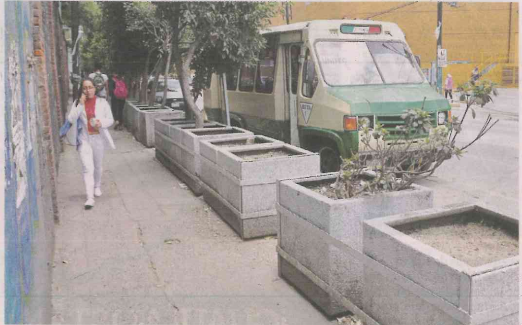
■ Mas de 200 macetones obstruyen el paso a peatones en la zona cercana de la tala.

En una reunión con autoridades de la Sedema la próxima semana, se definirán los criterios de la reforestación, en la cual los vecinos de Xoco requerirán árboles