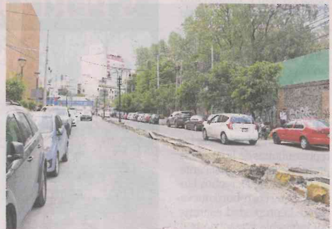
■ Personal de la Sedema ha retirado los tocones en el camellón donde estaban los árboles.

Hasta ahora, además de la multa impuesta por la Sedema, la dependencia no ha revocado el PATR para el desnivel otorgado a Mitikah en el Gobierno anterior, ni se han definido las medidas de compensación por el impacto ambiental provocado por las obras.