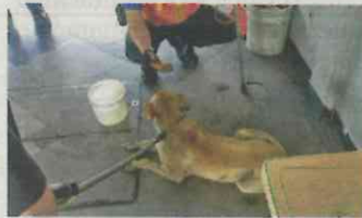
COBIJO. Esperan ser adoptados.

A las 8:35 horas en Atlalilco, Línea 8, fue detectado otro perro; el animal estaba desorientado y no permitió su rescate, hasta que llegó a Constitución de 1917. Los perros fueron llevados al Centro de Transferencia Canin del Metro. /REDACCIÓN