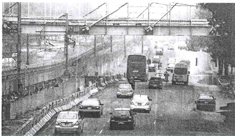
Claudia Sheinbaum, jefa de Gobierno, dijo que el nuevo proyecto del Metrobús en Zaragoza (en la foto) complementaría el servicio de la Línea A del Metro.

Secretaría invertirá 13 mmdp en obras. METRÓPOLI A21