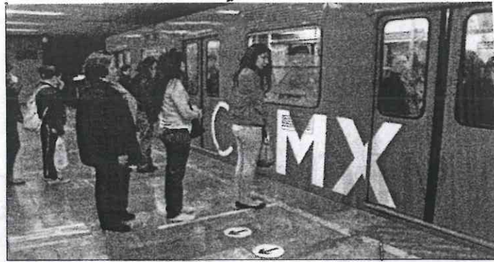
Este vagón exclusivo fue implementado desde el 2004 para evitar el acoso a mujeres.

► Viajar en uno de éstos es muy distinto a hacerlo en uno normal, pues entre todas generamos historias distintas