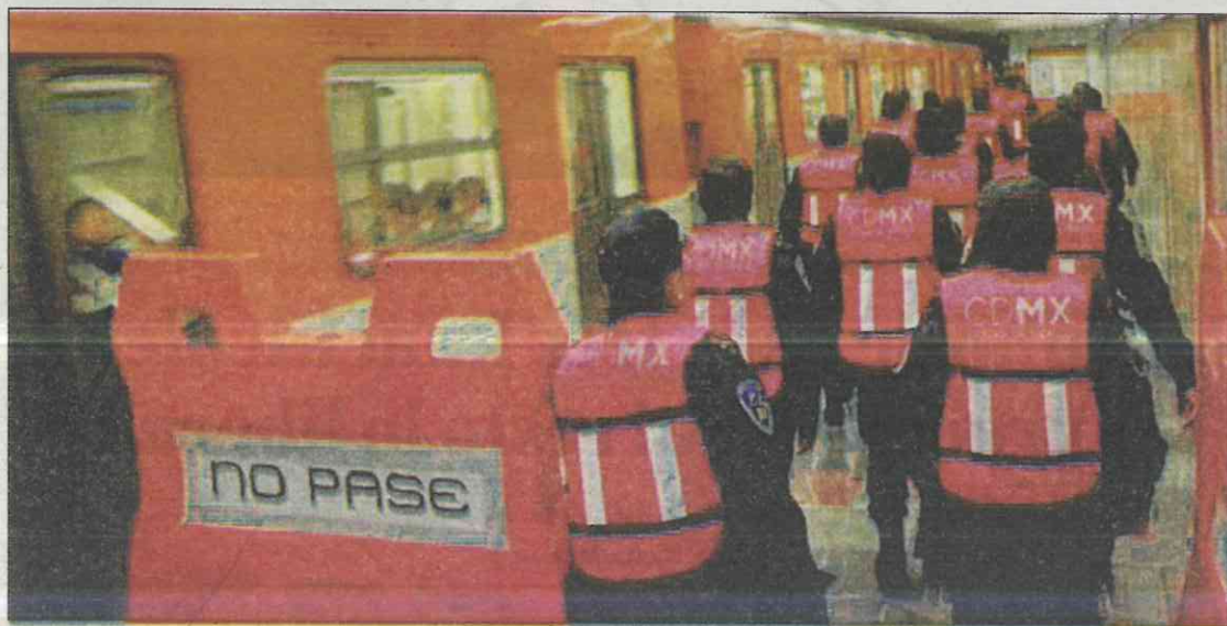
Todas las estaciones de la red cuentan con un espacio único para mujeres, regularmente llegan a ser los primeros dos vagones.

Aunque es fastidioso vivir encimadas, peleadas y hasta acaloradas, nos acostumbramos, ya que siempre la gente debe bajar, además no todo es malo en el Me-