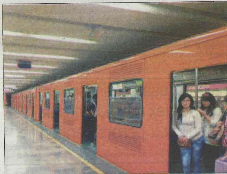
Se ha comprobado la disminución de los problemas de acoso hasta en un 26 por ciento.

Se ha comprobado que este problema ha disminuido hasta en un 26 por ciento.