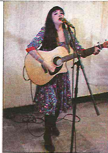
▲ La cantante y activista social, en una presentación en el Metro de la CDMX.

“Se rechazan categóricamente las graves imputaciones expresadas”, agregó.