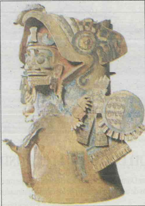
Braseo de guerrero encontrado en la Línea 2 del Metro.

Uno de los más importantes y conocidos hallazgos arqueológicos que el Metro de