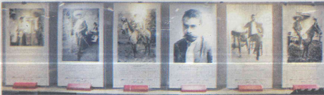
La exhibición consta de 78 paneles con información y fotografías de El Caudillo del Sur.

Dicho corredor es uno de los más concurridos: por alrededor de 2 millones de personas al mes. La exposición estará disponible al público hasta junio.