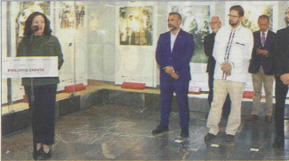
Durante la presentación estuvieron la directora del STC y funcionarios de la Subsecretaría de Prevención y Participación Ciudadana.

cha social por la justicia y la libertad en México. Hoy ponemos en contacto al pueblo que viaja en Metro con uno de sus héroes de la Patria más emblemáticos y queridos”, refrendó.