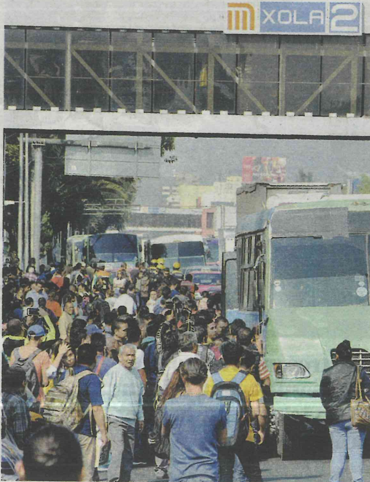
El Metro cumplirá 50 años el 4 de septiembre

No será necesario aumentar costo del boleto, para renovar y recobrar el prestigio del Metro