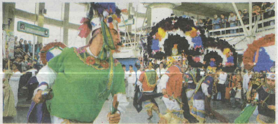
De toda clase de eventos, desde los musicales hasta los culturales, se encarga el STC.

La música de banda de viento, tradicional de Oaxaca, visitó el Metro, cuando un grupo de 60 niños y sus padres, provenientes de San Bartolomé Quialana, Juchitán de Zaragoza y San Bartolo Coyotepec, Oaxaca, interpretaron varias piezas típicas en las estaciones Tlatelolco, Línea 3; San Lázaro, Línea B; así como Pino Suárez,