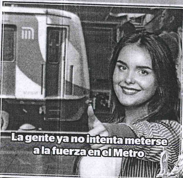
La gente ya no intenta meterse a la fuerza en el Metro