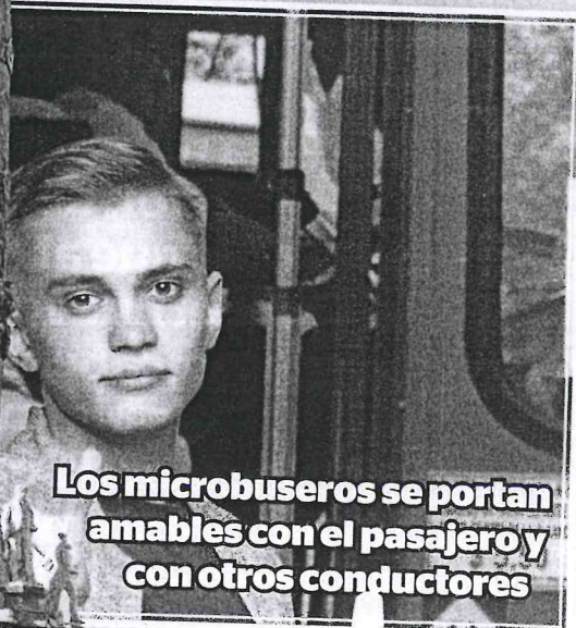
Los microbuseros se portan amables con el pasajero y con otros conductores