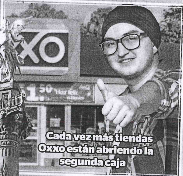
Cada vez más tiendas Oxxo están abriendo la segunda caja