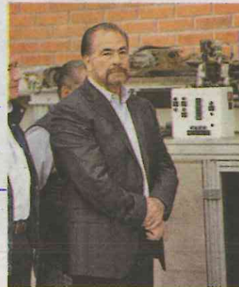
El líder gremial.

"En esta gran empresa han laborado 38 mil trabajadores, de los cuales permanecemos