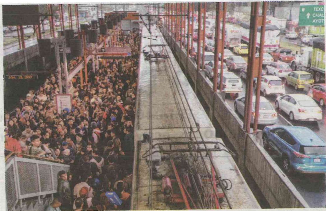
Algunos de los prolongados retrasos en la zona mexiquense se deben a casos de suicidios o accidentes.

Según las autoridades, en 2017 y lo que va de este año 22 personas se arrojaron a las vías