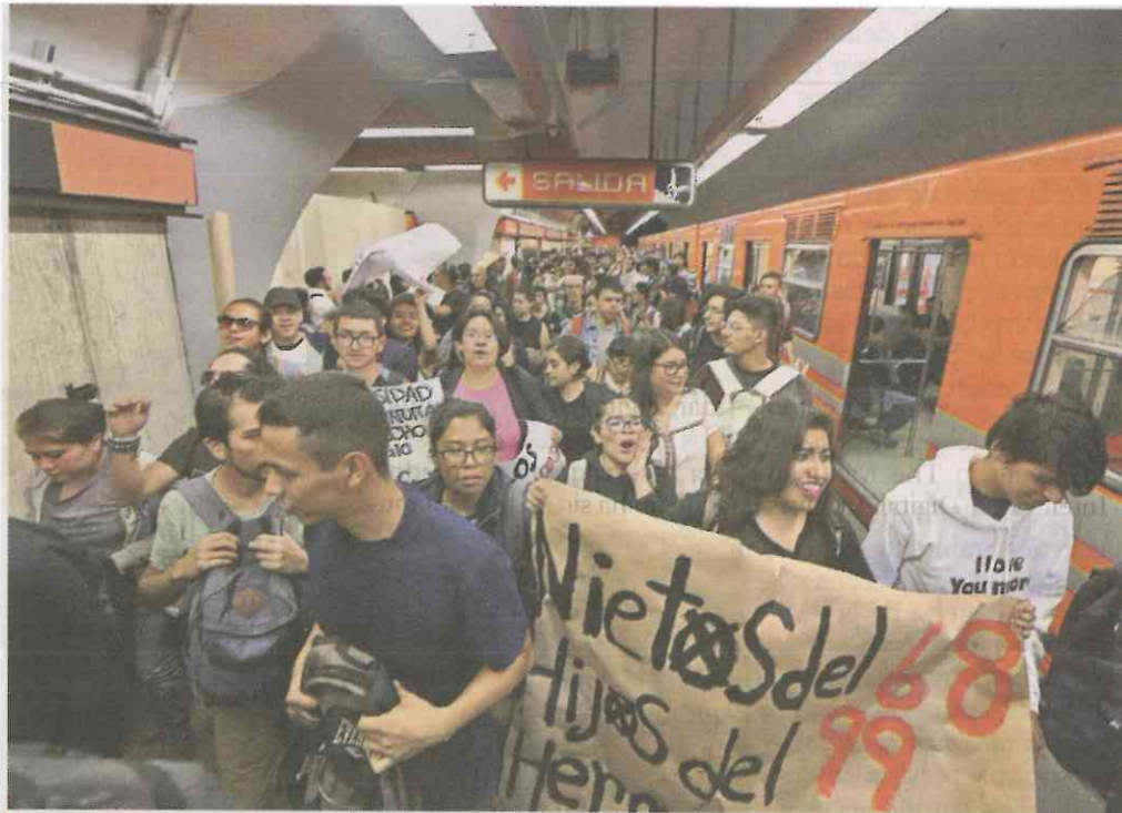
■ Cientos de jóvenes se trasladaron en Metro hacia el punto de reunión.

“Nuestros sueños no acaban en sus urnas 1968/2018”, dice el cartel que carga uno de los jóvenes. Llegan al Zócalo, con el puño izquierdo en alto, con la “V” de la victoria. “¡El que no brinque es porro! ¡El que no brinque es porro!”, y brincan, felices, jóvenes, alegres, a pesar de todo.