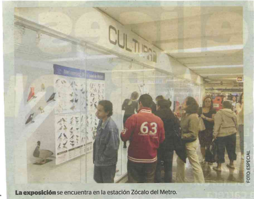
La exposición se encuentra en la estación Zócalo del Metro.

Las aves fueron hechas de barro y madera proveniente de caídas naturales de árboles, por ejemplo, en desastres naturales. "Uso madera de árboles que han caído naturalmente y barro que no requiere hornearse, porque quiero que los materiales aporten más de lo que quitan al planeta. Es decir, busco usar materiales amigables con la naturaleza", aseguró.