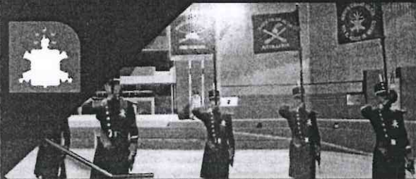
EJÉRCITO Y FUERZA AÉREA MEXICANOS COLEGIO MILITAR, LÍNEA 2.

Sexta estación emblemática, que en un área de dos mil 400 metros cuadrados rinde homenaje a hombres y mujeres de las fuerzas castrenses mexicanas. Las imágenes evocan al sistema educativo militar con especialidad en Áreas de Salud, Medicina Militar, Enfermería, Odontología, así como el adiestramiento, aplicación del Plan DNIII-E, labor social, desfiles, ceremonias y espectáculos aéreos.