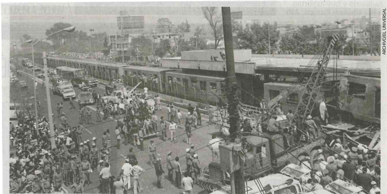
Aspecto del accidente del Metro aquel 20 de octubre de 1975, donde perdieron la vida 31 personas. En la imagen una grúa realiza maniobras para separar los vagones que colisionaron por culpa del conductor, según las investigaciones finales.