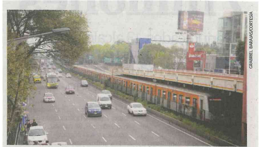
Vista actual de la estación Viaducto del Metro sobre calzada de Tlapan. Del lado derecho al fondo, aún se ve la “loma” de esta larga vía.