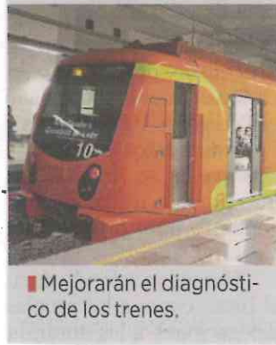
■ Mejorarán el diagnóstico de los trenes.

Subrayó que con esta tecnología, el personal del Metro será capaz de identificar fallas de manera preventiva, además de que, por su innovación, permitirá al Sistema de Transporte Colectivo ofertar servicios a nivel nacional e internacional.