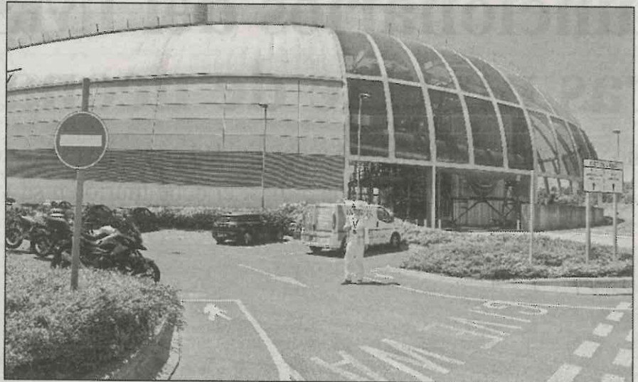
El gobierno de la Ciudad de México prevé que la planta de termovalorización, que se construye con mejor tecnología que la existente en Newhaven, Inglaterra (imagen), procesará 35 por ciento del total de desechos

“Aquí vienen las tecnologías para generar energía eléctrica, 4 mil 500 to-