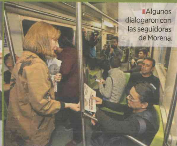
■ Algunos dialogaron con las seguidoras de Morena.