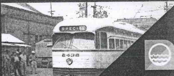
LA CATENARIA CONSULADO, LÍNEA 5.

➤ VEU I CORDES MÚSICA 17:45 A 18:30 HRS.