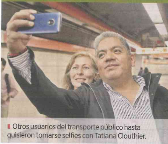
■ Otros usuarios del transporte público hasta quisieron tomarse selfies con Tatiana Clouthier.

La candidata al Senado en la CDMX por la coalición "Juntos Haremos Historia", Citlalli Hernández y la asesora de AMLO, Tatiana Clouthier, se subieron al Metro a promocionar a Morena. Recorrieron la Línea 7 con jóvenes brigadistas y entregaron volantes y periódicos "Regeneración".