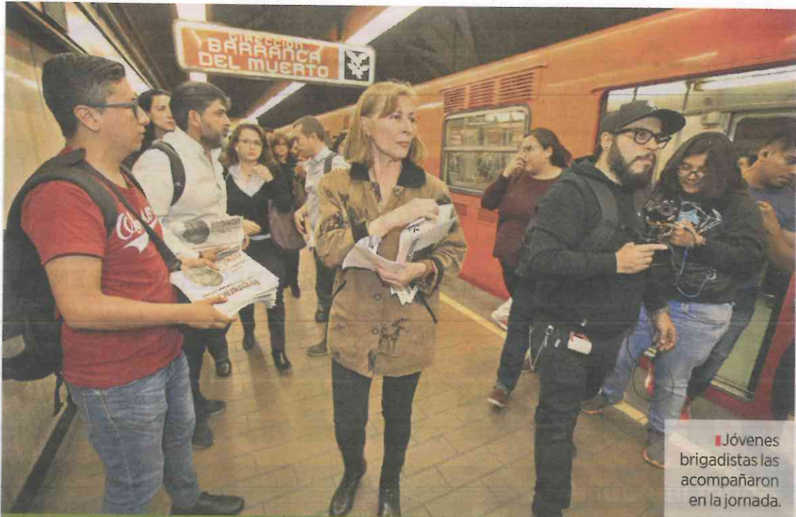
■ Jóvenes brigadistas las acompañaron en la jornada.