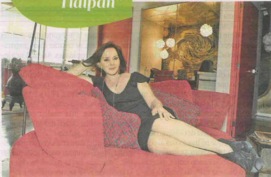
La aspirante a la Jefatura de Gobierno fue subsecretaria en Comunicaciones y Transportes

“Yo me pregunto qué historia hizo Sheinbaum en la delegación Tlalpan”