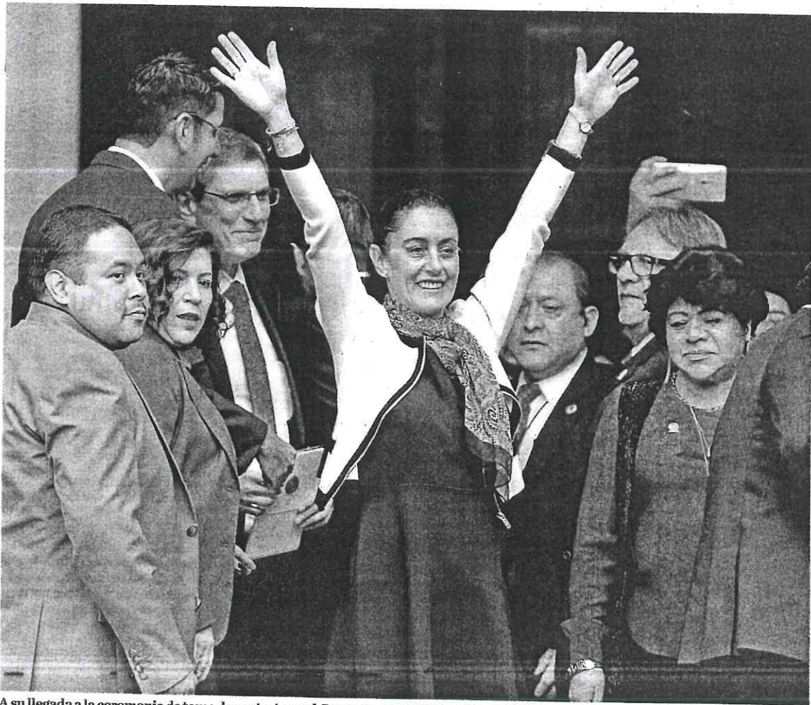
A su llegada a la ceremonia de toma de protesta en el Congreso capitalino.