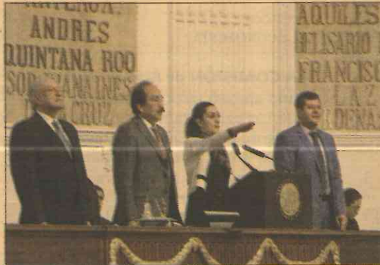
Claudia Sheinbaum Pardo toma protesta ante el pleno del Congreso local como jefa de Gobierno.

RESOLVER LOS problemas en materia de movilidad y medio ambiente son algunas de las prioridades de la jefa de Gobierno de la Ciudad de México, Claudia Sheinbaum Pardo, en su administración (2018-2024).