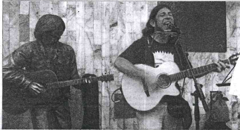
Fotografía tomada momentos antes del sismo, el pasado martes 19 de septiembre.

“En las primeras estrofas, alguien gritó ‘¡está temblando!’”, de hecho quien lo hizo parecía emocionado porque ocurría en el momento del homenaje a Rockdrigo que murió en el terremoto del 85”, recordó el músico