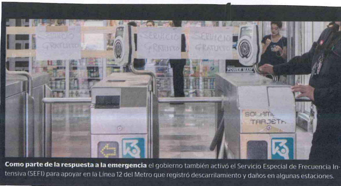
Como parte de la respuesta a la emergencia el gobierno también activó el Servicio Especial de Frecuencia Intensiva (SEFI) para apoyar en la Línea 12 del Metro que registró descarrilamiento y daños en algunas estaciones.

Por el Ecopark se dejó de recibir un millón 820 mil pesos por el servicio que se dejó de cobrar en las colonias Roma, Condesa, Polanco, Anzures y la delegación Benito Juárez