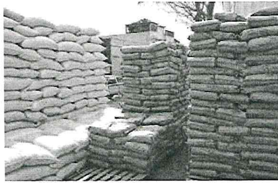
COSTALES de granos de maíz, embodegadas en centros Segalmex, el año pasado.

EL PRESIDENTE advierte que responsables irán a la cárcel; reconoce que aún hay funcionarios de gestiones pasadas "mal acostumbrados"; pese a atrasos, programa va a Tlaxcala y Puebla