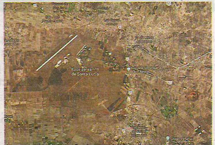
La base militar ya se visualiza en Google Maps. ESEPCIAL