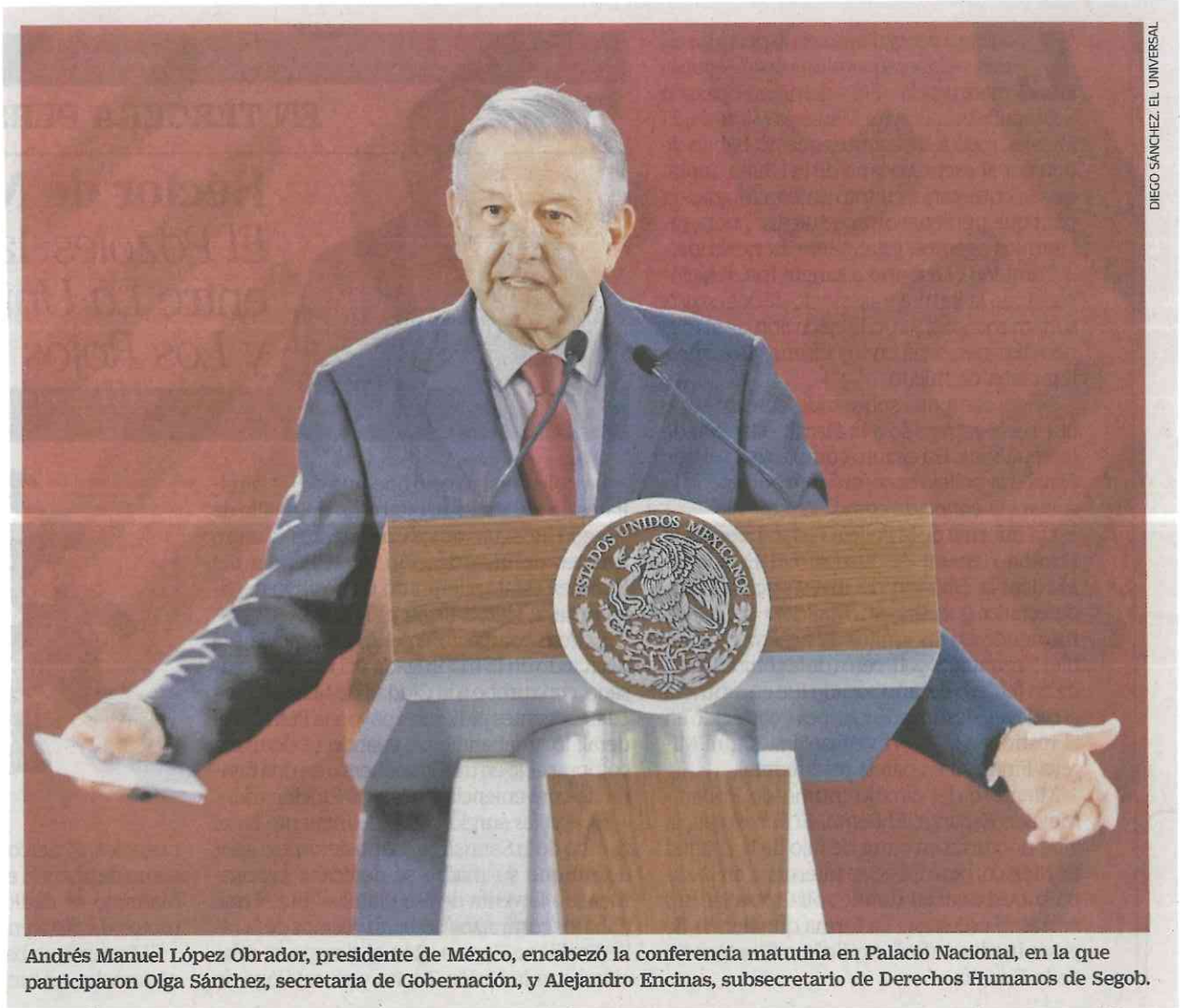
Andrés Manuel López Obrador, presidente de México, encabezó la conferencia matutina en Palacio Nacional, en la que participaron Olga Sánchez, secretaria de Gobernación, y Alejandro Encinas, subsecretario de Derechos Humanos de Segob.