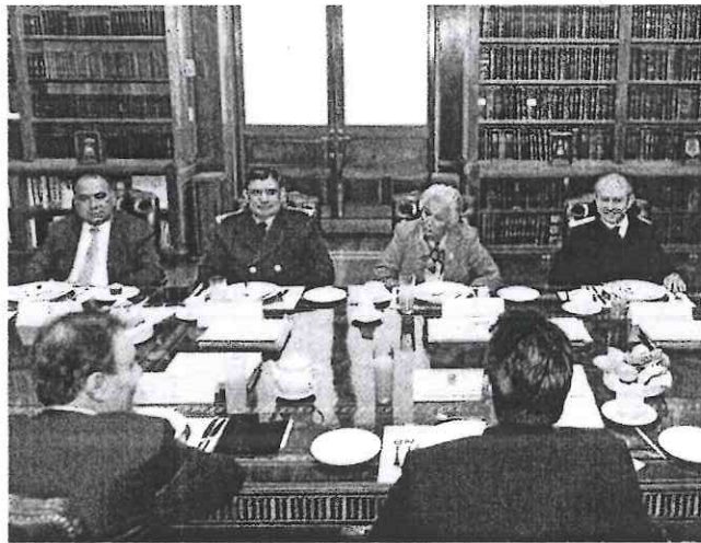
FUNCIONARIOS federales con el gobernador de Guerrero, Héctor Astudillo (izq.), ayer, en la Secretaría de Gobernación.

Miguel Ángel Riquelme, Ejecutivo de Coahuila, señaló: "Abiertamente nos hemos pronunciado a favor de la Guardia, hoy existe una propuesta que puede transitar en consenso, si el mando es civil".