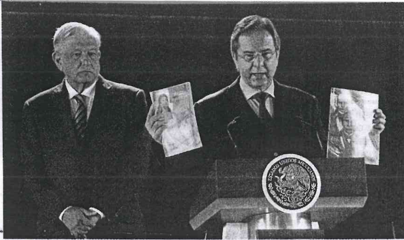
ESTEBAN Moctezuma (der.), con el Presidente Andrés Manuel López Obrador.