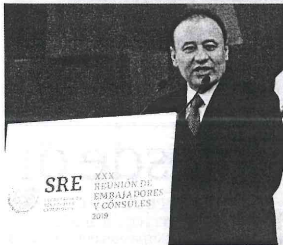
ALFONSO Durazo, en la XXX Reunión de Embajadores, ayer.

EL TITULAR de la SSPC anuncia apertura a intervención de organismos internacionales para proteger las garantías individuales; resalta la necesidad de revisar procesos