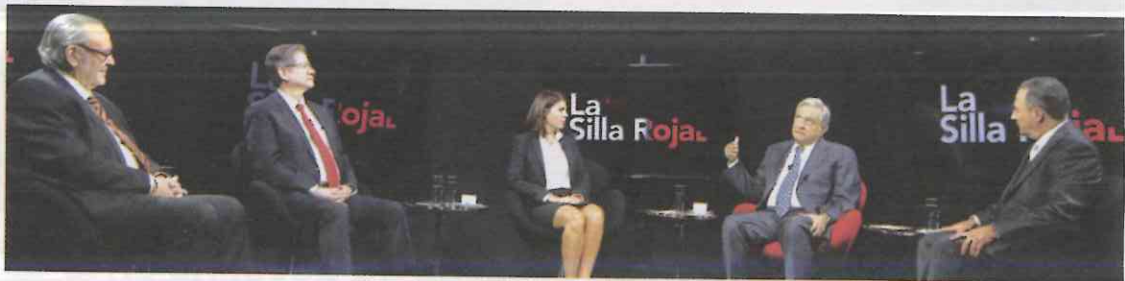
PRENSA. El presidente dijo que no habrá censura y que impulsará el debate, el derecho a la réplica y el diálogo circular.

“Tenemos que buscar la conciliación, el debate no es odio; yo no odio a nadie, no tengo fobias, y soy feliz”