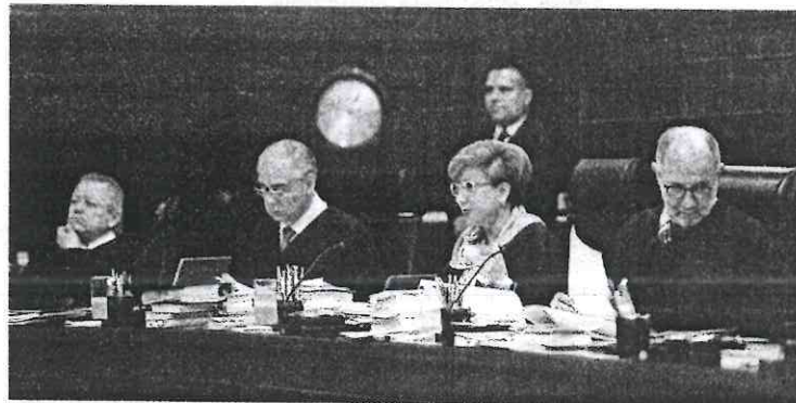
EL PLENO de la Suprema Corte, en una imagen de junio pasado.

EL PLENO DE LA CORTE reitera su autonomía en el tema de remuneraciones; funcionarios continúan con seguro de gastos médicos mayores y demás prestaciones