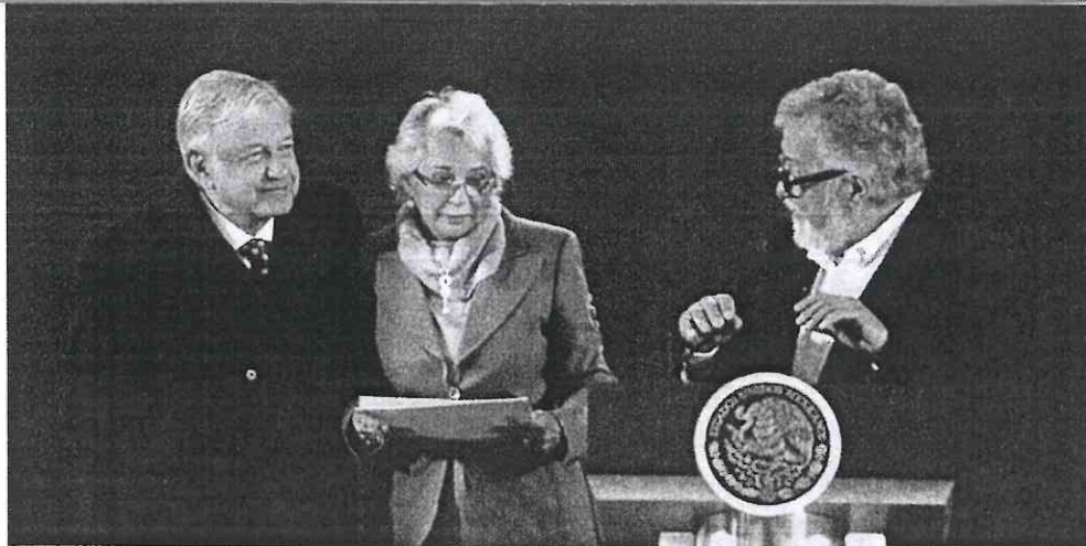
Andrés Manuel López Obrador, Presidente de México

“Ningún ciudadano será víctima de represalias por su manera de pensar o por su postura política. Que no se fabriquen delitos a opositores”