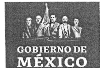
Imagen del Gobierno federal sólo incluye a hombres.