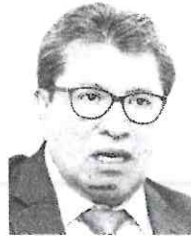
Ricardo Monreal Senador de Morena

Informó que a diario se consumen en México 120 millones de litros de gasolina, de los cuales, 10 millones de litros, 8 por ciento, son de combustible robado. “En este delito tenemos el deshonroso segundo lugar a nivel mundial; sólo nos supera Nigeria”, acotó.