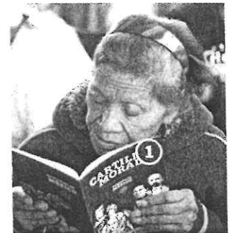
Beneficiaria de programa social lee el libro entregado ayer.

En diciembre, el vocero presidencial dijo que las mujeres estarían presentes, pero no en logo oficial.