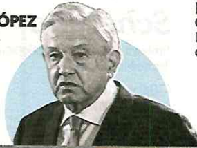
ANDRÉS MANUEL LÓPEZ OBRADOR Presidente de México