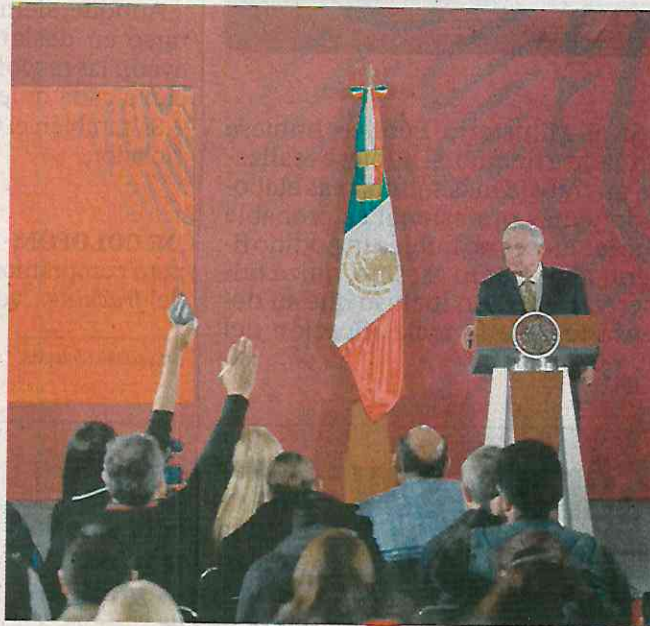
GERMÁN ESPINOSA. EL UNIVERSAL

El compromiso 86 es constituir 266 coordinaciones de seguridad pública en todo el país, que serán atendidas por la Guardia Nacional para proteger a los ciudadanos vícti-