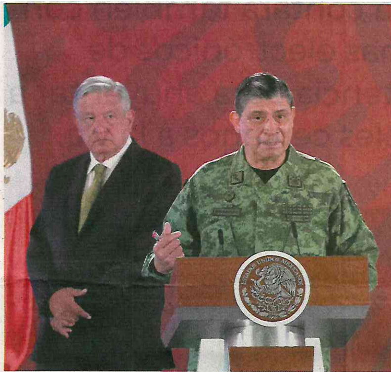
GERMÁN ESPINOSA. EL UNIVERSAL