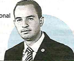
MARKO CORTÉS Líder nacional del PAN

"La 'Ley Bonilla' es inconstitucional, un ataque a la democracia, que debe ser anulado"