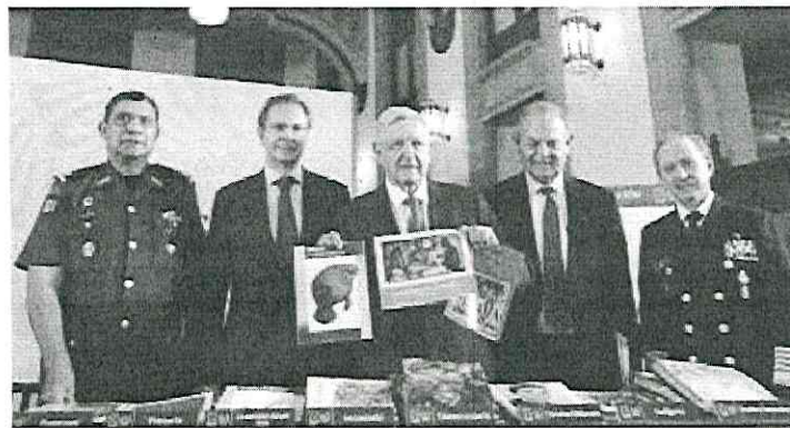
DE IZQ. A DER.: Luis Crescencio Sandoval, Esteban Moctezuma, el Presidente Andrés Manuel López Obrador, Antonio Meza y Rafael Ojeda, ayer, al presentar los ejemplares.

Agregó que para los alumnos de secundaria se imprimieron 330 diferentes títulos y habrá 35 millones de ejemplares; en telesecundaria, 27 títulos y 10 millones de ejemplares; en primaria, 74 títulos y 105