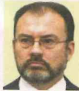
LUIS VIDEGARAY SECRETARIO DE LA SRE

"La fecha y horario del partido se establecerá cuando se revele el itinerario de la temporada 2019 en la primavera próxima", dice el comunicado.