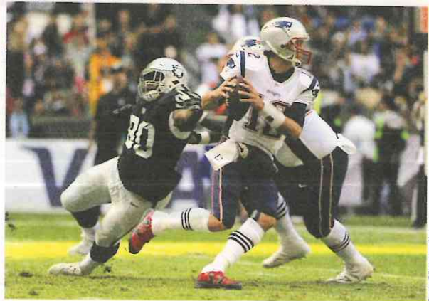
BRADY en el duelo de la NFL México el año pasado.

El acuerdo tiene el aval de Televisa, dueña del Azteca, según el comunicado. El dueño de la televisora, Emilio Azcárraga Jean, subió una carta a redes ofreciendo disculpas por el cancelamiento del partido de ayer por la noche.