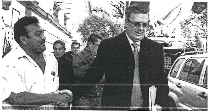
EL EXJEFE DE GOBIERNO, tras una reunión privada con Andrés Manuel López Obrador, el pasado viernes.

EL PRÓXIMO canciller recuerda que la invitación a la toma de protesta se envió a todos los países con embajada; confirmados, 24 jefes de Estado y vicepresidentes