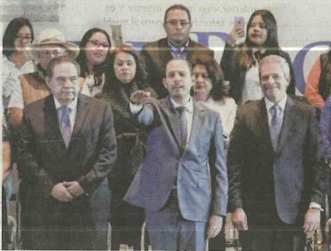
Marko Cortés rindió protesta como presidente nacional del PAN ante un pequeño grupo de militantes que acudieron al acto.