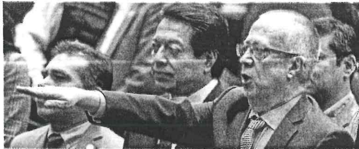
CARLOS URZÚA. Primer secretario de Hacienda en ser ratificado por el Congreso.