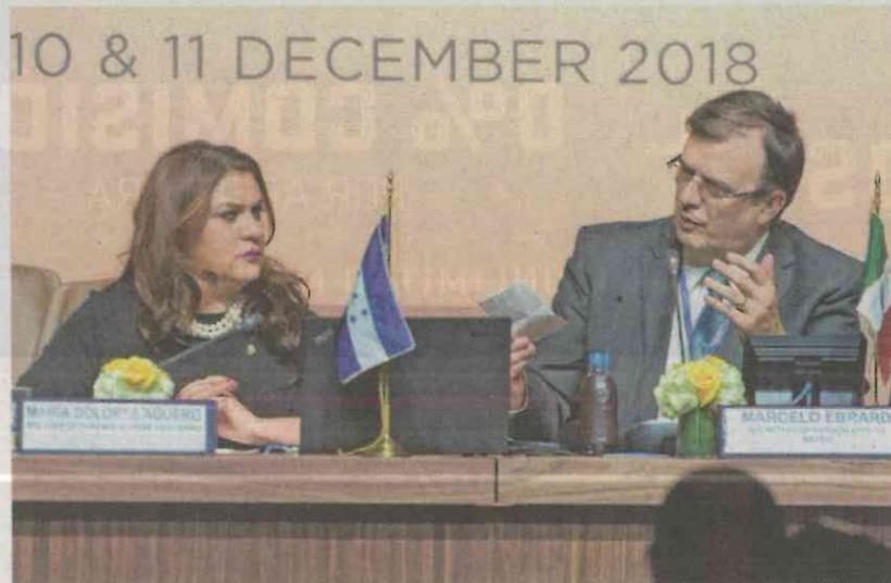
México prevé 35 mil millones de dólares de inversiones en este plan, “la primera y más importante aplicación del pacto”, declaró Marcelo Ebrard.